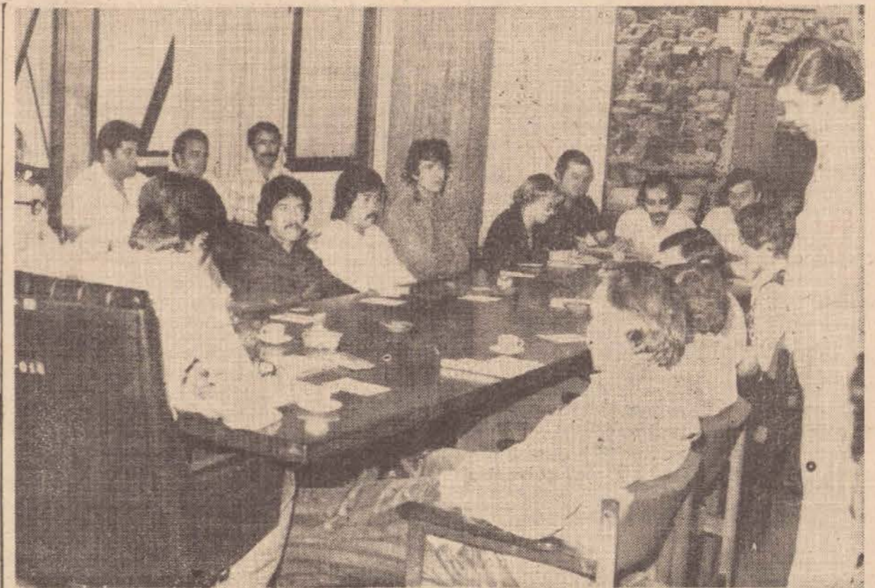
Na foto, o prefeito Paulo Constantino presidindo ontem reunião com todos seus assessores, quando diversos assuntos foram enfocados.

Com essa medida tomada de forma inesperada pelos industriais da carne, espera-se que os revendedores também reduzam o preço do produto, em benefício da população consumidora.