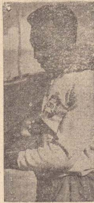
Pelé voltou a vestir a camisa do Brasil anotando 2 dos gols.

zaga direita, porque em um jogo faltou elemento para a posição. Conseguiu boa atuação e ficou algum tempo na zaga, quando então o Corinthians excursionando pelo nordeste conseguiu a sua contratação. Acrescentou que gosta mais da posição de ponteiro.