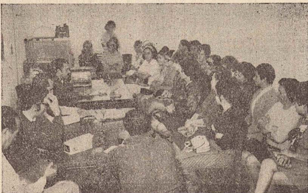
Na foto, a reunião ontem à tarde, na APAE.