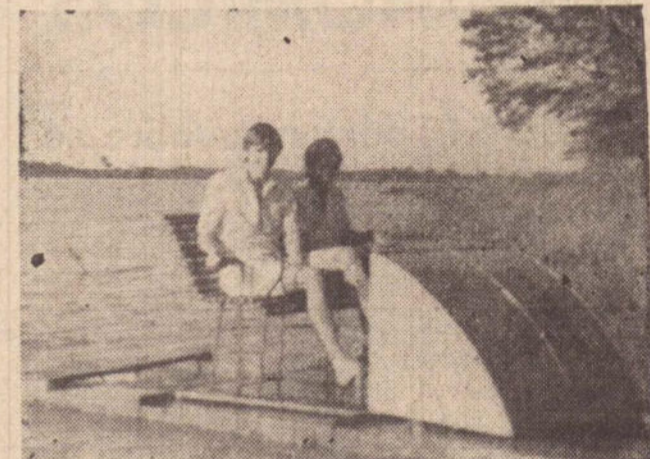
Um novo prazer às margens do rio Paraná: o "pedalinho"