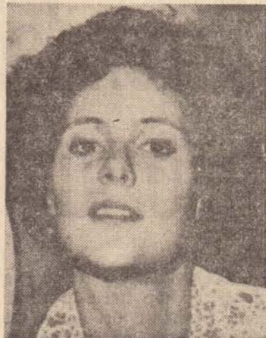
GAL COSTA HOJE NO ESPECIAL DE JORGE BEN

E para quem é vidrado em boa música popular brasileira, a dica é ficar em casa hoje e assistir ao especial do cantor Jorge Ben. Não só pela presença do Ben e da Banda do Zé Pretinho, mas também pelo grande número de participantes convidados. Nessa relação está Gal Costa, que abrirá o programa interpretando "Que Pena". No show estão presentes várias músicas do novo disco de Jorge Ben. "Bem Vinda Amizade".