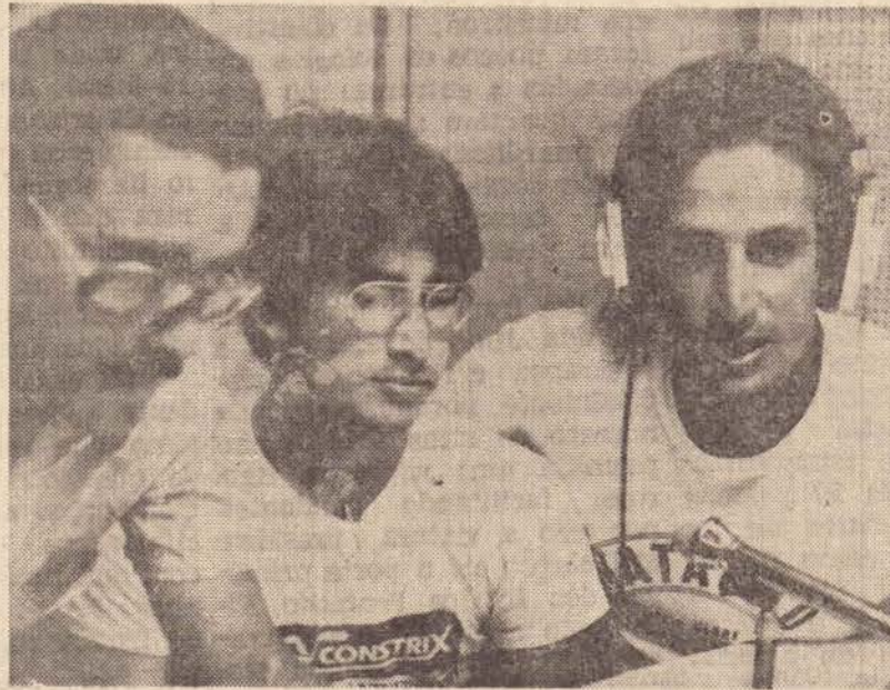
Os membros dos diretórios acadêmicos de Direito e Administração, percorreram ontem as emissoras e os jornais, pedindo a colaboração do povo ao trote filantrópico.

Os estudantes estão acreditando num grande resultado e dizem que este trote ultrapassará o anterior em arrecadação. Mesmo porque, neste, o que for arrecadado não vai só para o SOS — Serviço de Obras Sociais, mas também para o Lar dos Meninos, duas entidades em difícil situação financeira.