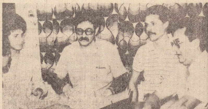
Os integrantes da Chapa DACA em nossa redação

Informaram os universitários que se a chapa for eleita, os pontos principais que pretendem realizar são: 1) restituir ao diretório a confiabilidade que, por razões várias, encontra-se abalada no meio dos seus associados; 2) consulta para submeter à apreciação dos associados, através do voto direto e secreto, proposta sobre a permanência do atual nome — DAPOMI, ou volta ao anterior — DACA; 3) instalação do departamento jurídico para estágio supervisionado; 4) ciclo de conferências (aperfeiçoamento da cultura jurídica, ampliação da cultura geral); 5) dinamizar o esporte e o lazer; 6)