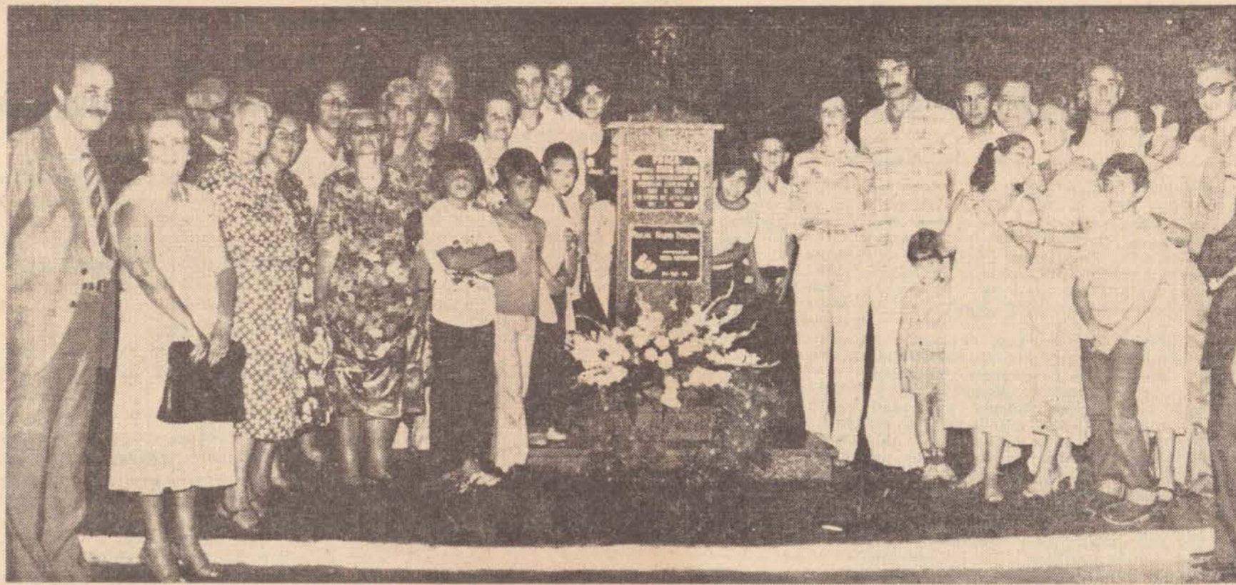
Uma foto para a posteridade, junto ao busto e à placa com a denominação oficial de "Praça Mario Eugenio", do Jardim Bongiovani.