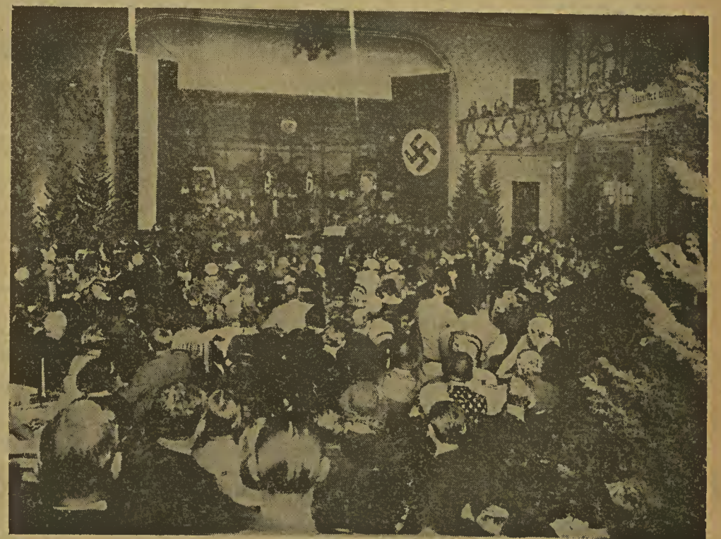
Deutsche Hitler-Feier, veranstaltet von der Ortsgruppe Curityba der Hitler-Bewegung

Guter, neuer Freund! Als der Führer Adolf Hitler den Befehl gab, alle Einzelaktionen sofort einzustellen, gehorchte die Braune Armee wie ein Mann. Die Revolution aber, die Revolution geht weiter, und es ist die Revolution des Nationalsozialismus! Die Braune Armee hat diesmal die deutsche Geschichte geschrieben und wir wollen, guter, neuer Freund, die von der Front heimkehrenden Truppen nicht ein zweitesmal um ihren Lorbeer betrügen. Denn wo sassest denn du, als dieses Reich erobert und erkämpft wurde, als Grzesinski noch seine Gummiknüppel sausen liess und die Mordkommune in den Gassen tobte? Mit Protesten bist du einhergeklirrt und hast die Luft erfüllt mit deinen Klagen. Du warst der Held der nationalen Etappe. Ja, das bist du gewesen, der Freund der Ruhe, die Feigheit heisst, der Anbeter der Robeiten! Unbändig ist der Wille zum neuen hat getan, was du nur redetest.