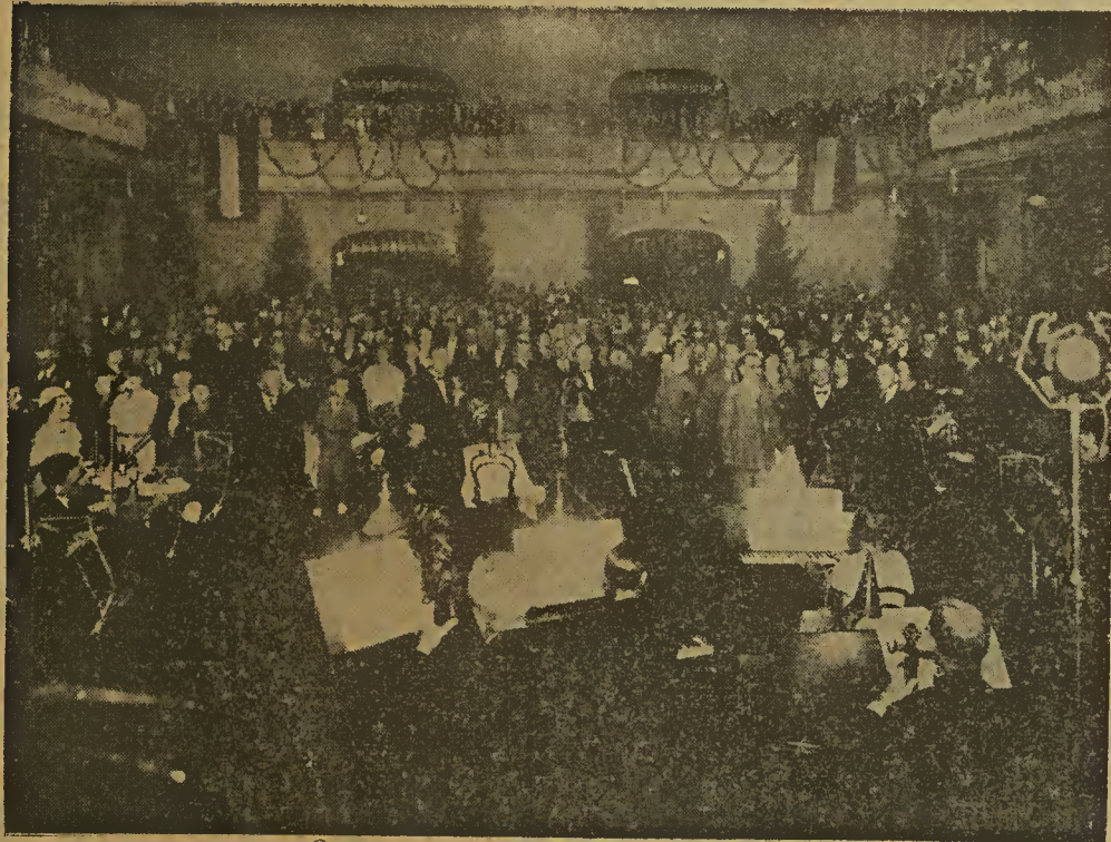
Deutsche Hitler-Feier, veranstaltet von der Ortsgruppe Curityba der Hitler-Bewegung