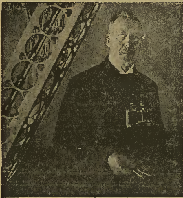
Der Kommandant Dr. Eckener

senhor e senador de um país, que muito respeitamos, effectivamente fez taes declarações, sentimos muito não tomal-o a serio.