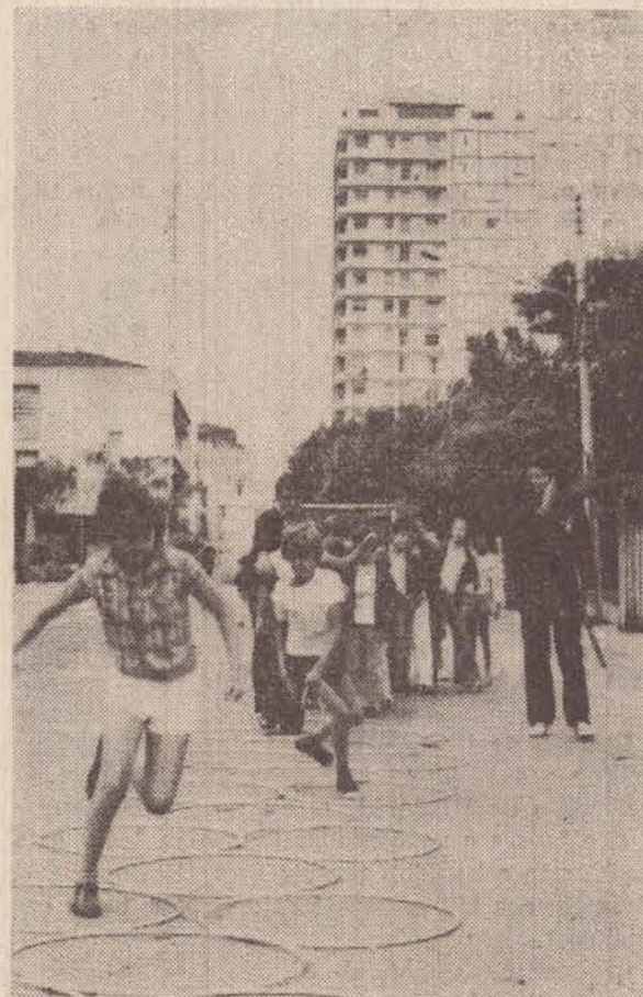
Um grupo, brincando de "Amarelinha", sob a orientação de uma universitária