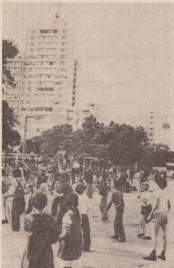
Outro grupo de crianças, participando de outra atividade

O prefeito Walter Lemes Soares, prestigiou, comparecendo e durante muito tempo, observou a participação das crianças, sempre orientadas pelos universitários, nas diversas atividades.