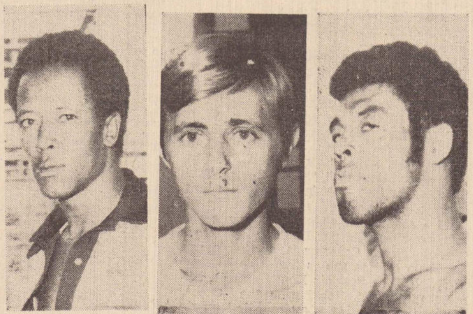
Estes são os três ladrões e as munições que estavam em seu poder

Depois de ouvidos e julgados na Comarca de Rancharia, serão recambiados para o Estado do Paraná onde cumprirão suas penas.