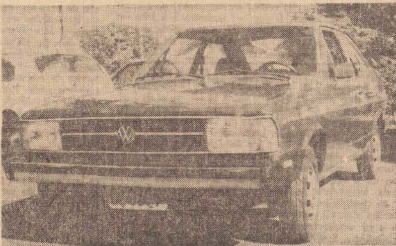
A primeira apreensão foi feita pela Policia Militar neste Passat de Assis.