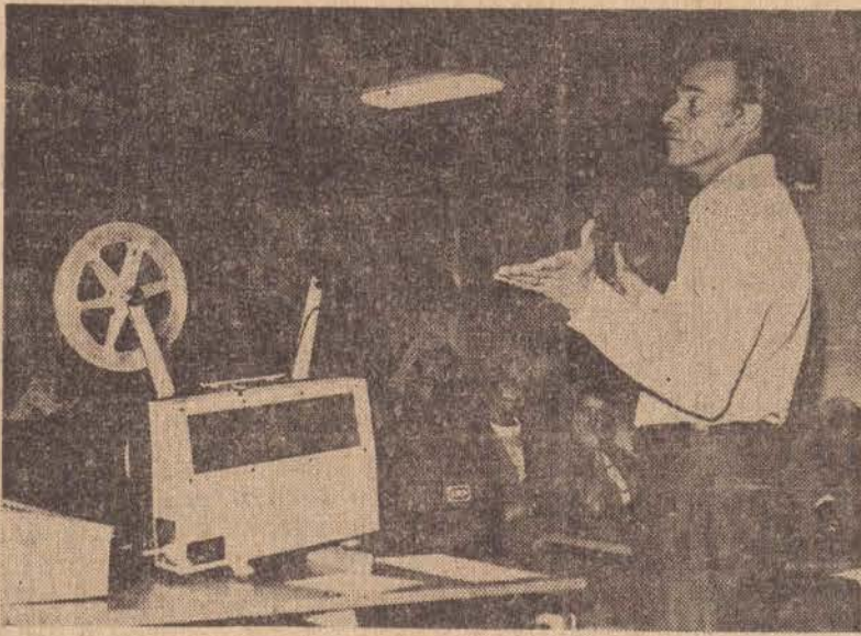
Aspecto de uma das palestras