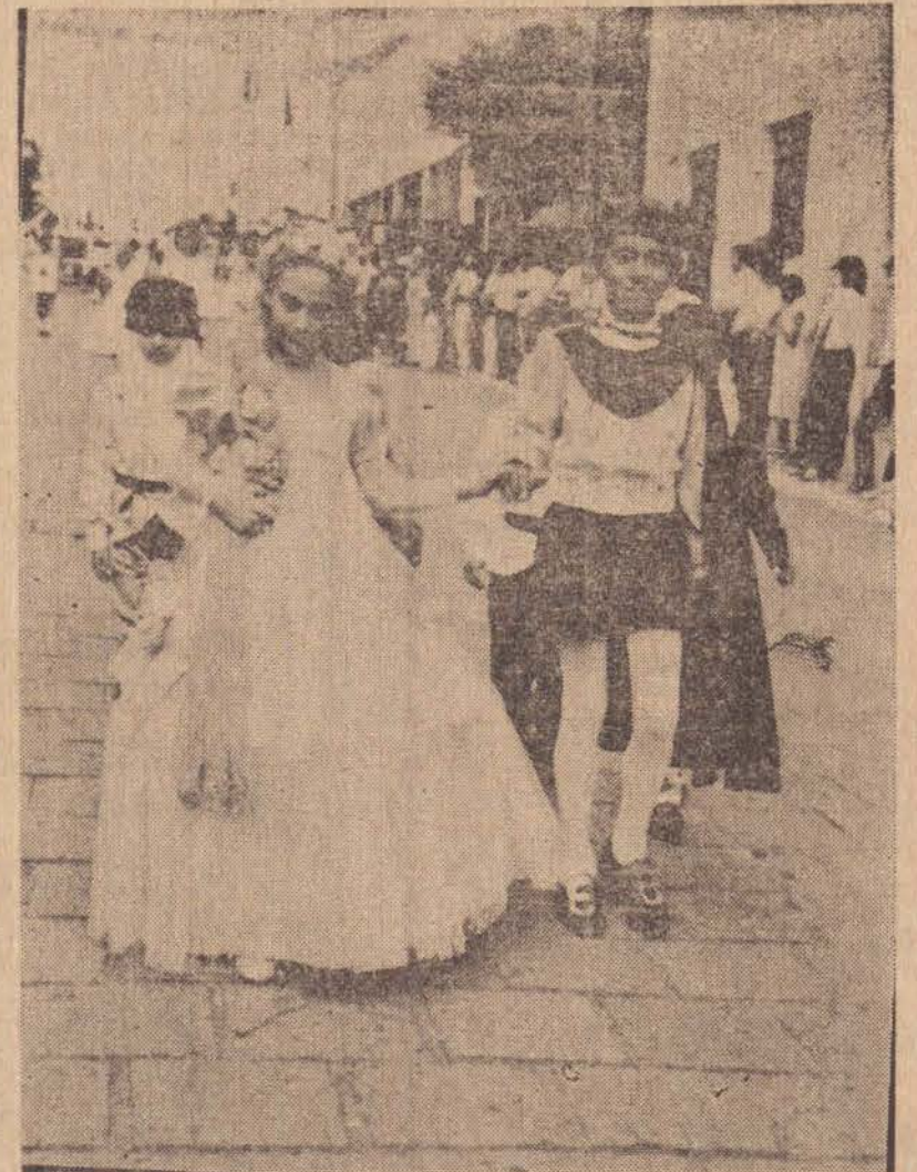
Os alunos do Centro Educacional do SESI com a alegoria Rapunzel.