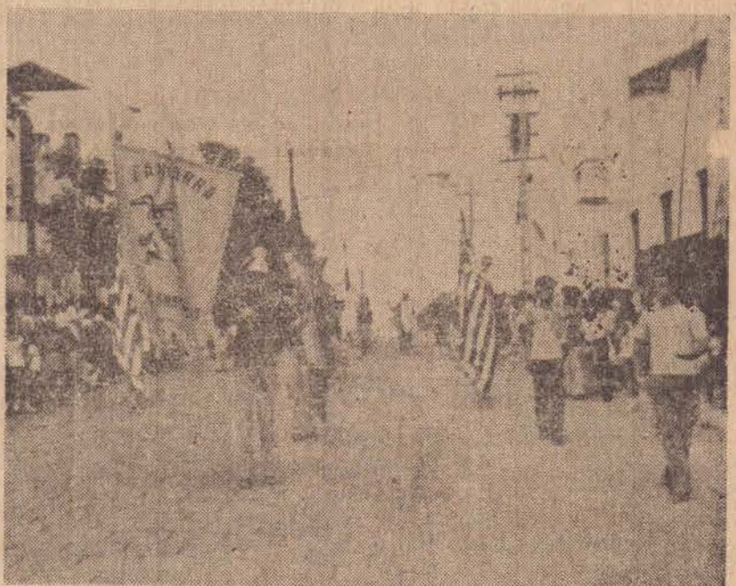
A fanfarra de Santo Anastácio, uma atração no desfile.