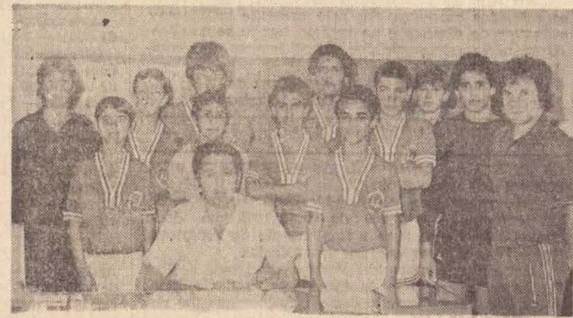
Equipe de Hand-Ball da EEPG Plácido Braga Nogueira, que a partir de segunda-feira estará em Itú, decidindo o título Estadual de Hand-Ball, no Campeonato Colegial, categoria Mirim.

Na segunda fase, a equipe do Plácido Braga Nogueira, enfrentou adversário da Delegacia Regente Rancharia. A 3.ª fase realizada em 5 dias na cidade de Adamantina, a equipe