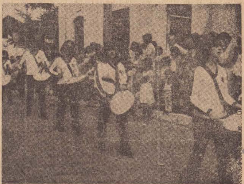
Fanfarra da Escola Técnica de Alvares Machado.