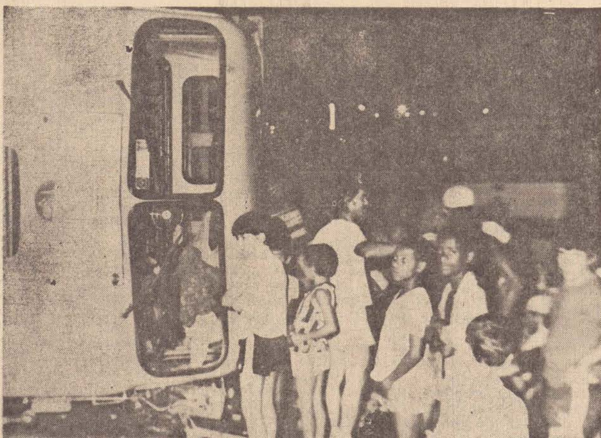
O FNM bateu no poste e no barranco e, depois, tombou.