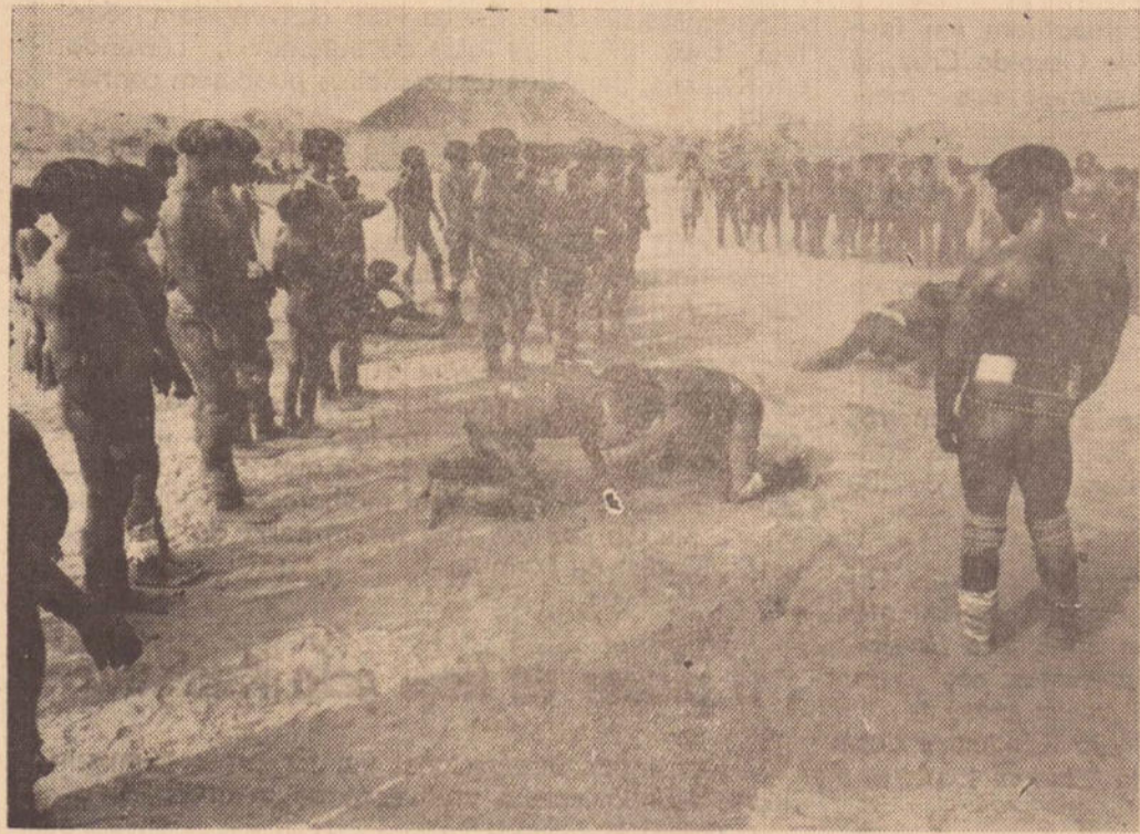
Por Luis Salgado Ribeiro do Serviço Especial da Agencia Estado.

Queremos que, no futuro, o índio seja emancipado. Para isso é necessário que ele tenha habilitação suficiente para exercer uma atividade útil e compreensível dos usos e costumes da Sociedade Nacional. Dentro de um sistema capitalista como o nosso, será preciso que o índio entenda a nossa sociedade de consumo.