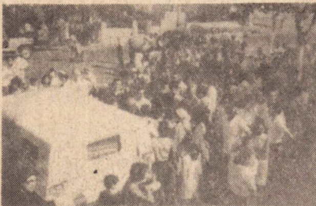
Até a saída do último carro, ninguém arredou pé.