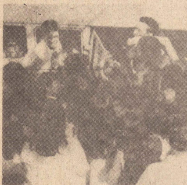
Crianças, moças e rapazes quase impediam a entrada dos sacerdotes no veículo para o retorno triunfal.