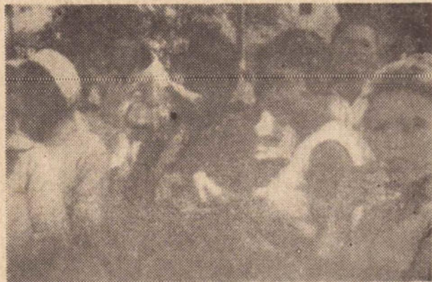
O choro compunha o quadro de tristeza da despedida.