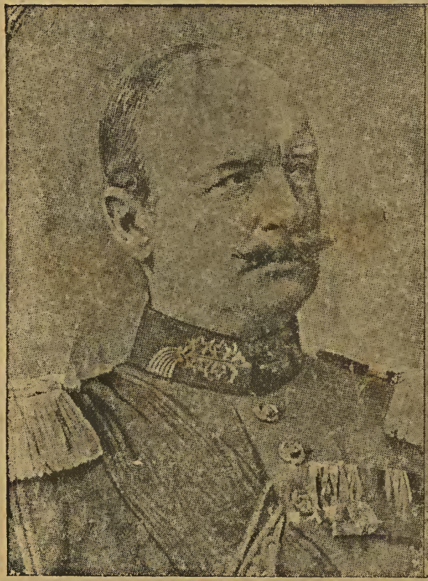
König Friedrich August von Sachsen

„Die Deutschen betreten heute nachmittag um zwei Uhr die belgische Hauptstadt. Die Regierung hatte künsterweise in letzter Stunde die Bürgergarde entlassen, welche die Deutschen nicht als Kriegführender anerkennen, und die Stadt ausschließ-