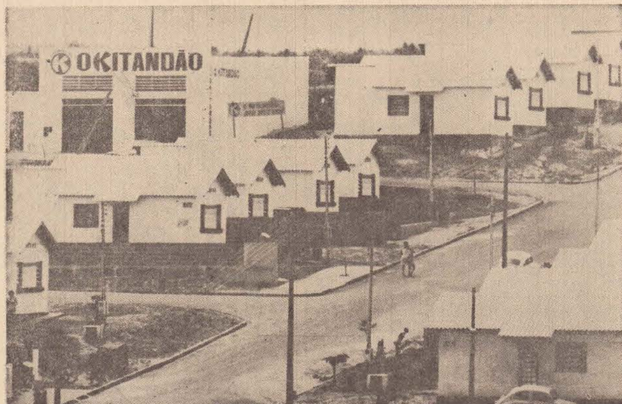
Cecap e Cohab somam 1750 casas populares, que foram construídas sem escola nas imediações.