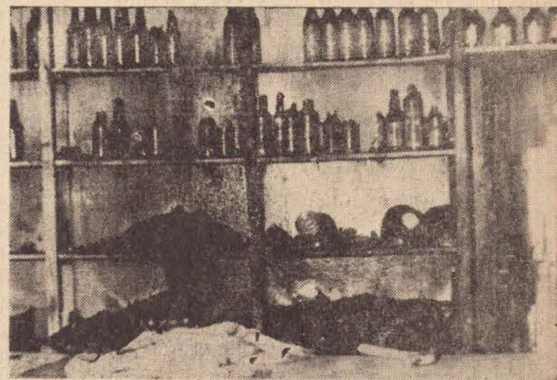
As garrafas explodiram na plateleira.

O prejuízo se resumiu a danos na geladeira, balcão, mercadorias, cereais, latarias, instalações elétricas e as bebidas que com o calor explodiram na plateleira.