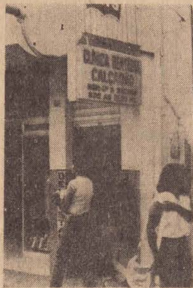
A polícia abriu inquérito contra a clínica dentária.