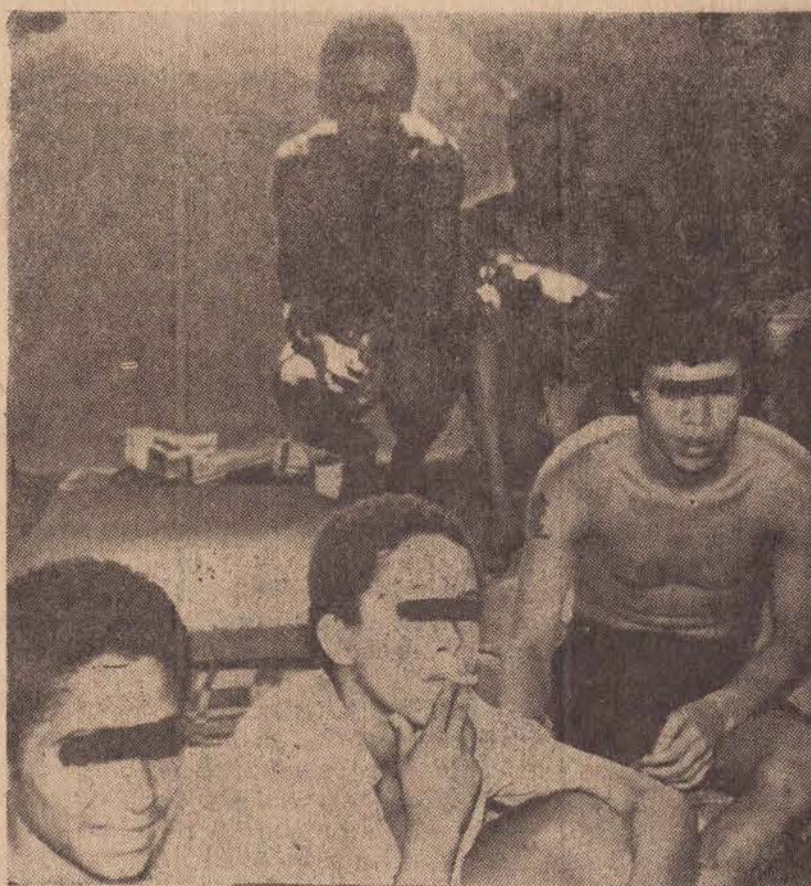
Os menores infratores, numa sela superlotada da cadeia local

"Eu apelo mais uma vez ao bondoso povo de Presidente Prudente, pedindo a sua