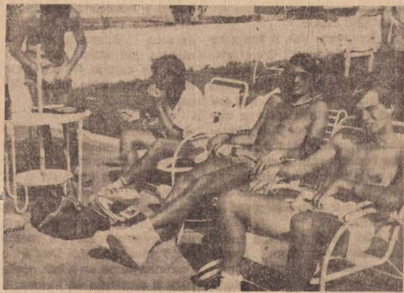
Os tenistas descansam antes do início dos treinamentos examinando suas raquetas.