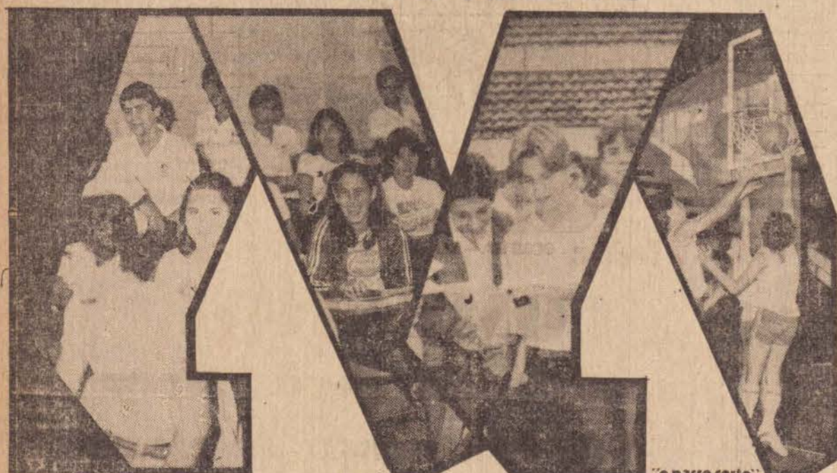
"o passo certo"

O Alto Padrão de Ensino do Colégio Joaquim Murtinho Está ao seu Alcance: