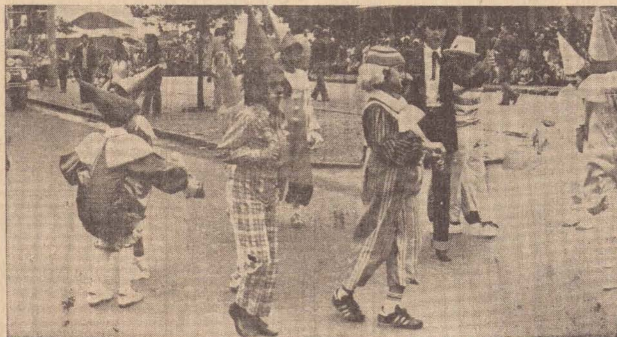
Os palhaços, à pé, deram a nota alegre do desfile