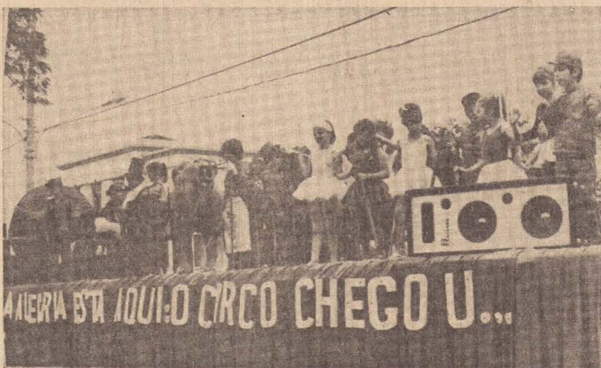
O Circo Chegou! Toda a trupe de um circo sob o imenso tablado móvel.

"A Alegria está aqui: o Circo chegou...". Toda a alegoria foi muito bem explorada, não apenas sobre uma carreta que se transformou num imenso picadeiro como dos palhaços que acompanharam o carro, arrancando aplausos da multidão.