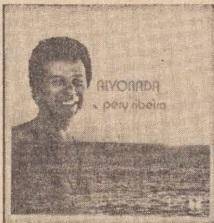
PERY RIBEIRO LANÇA O LP "ALVORADA"

Com apenas uma semana de lançado no mercado, o novo LP de Clara Nunes — "Esperança" — entrou direto no 30.º lugar das paradas de sucessos em todo o país, com uma vendagem antecipada de 100 mil cópias. Clara iniciou uma excursão pelo Sul do país, só regressando dia 24 para a festa de lançamento do LP "Esperança".