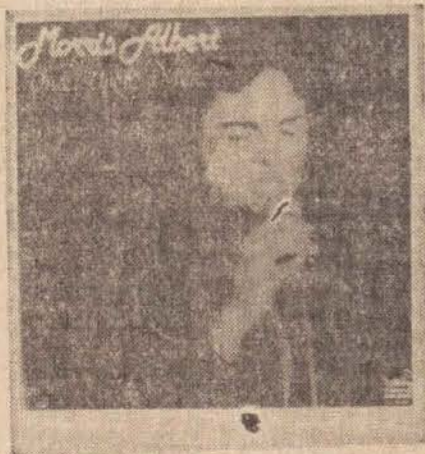
NA PRAÇA MAIS UM LP DE MORRIS ALBERT