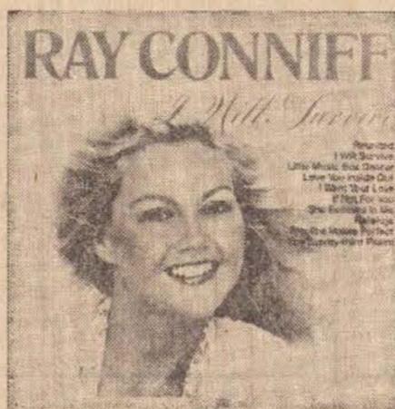
Ó SEMPRE RAY CONIFF

Gonzaguinha iniciou dia 12, no Teatro Procopio Ferreira, seu show "Gonzaguinha da Vida".