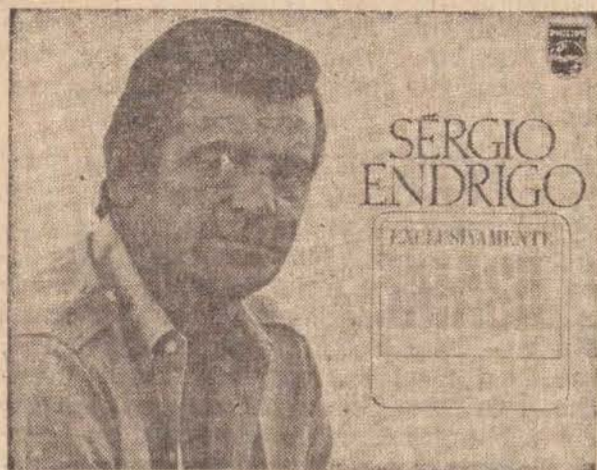
ENDRIGO CANTA NOSSAS MUSICAS

Considerado um dos maiores talentos da chamada geração romântica dos anos 60, Sergio Endrigo é sem dúvida um dos maiores sucessos da música italiana em todo o mundo. Apesar de sua natureza romântica, seus temas contêm, muitas vezes, mensagens com forte conteúdo social e político, levemente impregnadas de ironia e com acentuados traços de crítica ao modelo italiano da sociedade de consumo, do pós-guerra. Aqui, no Brasil, seus grandes sucessos perduram ainda na mente de muitos e nas paradas musicais, como "Annamaria", "Io Che Amo Solo Te", "Teresa", "Elisa, Elisa", "Canzone Per Te" e tantas outras.