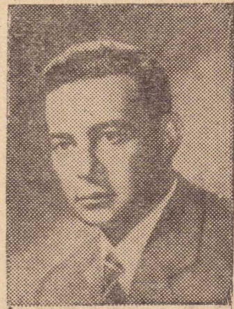
Auro de Moura Andrade

estabilização do mercado. O povo, precisa eliminar a inflação, e, também, é preciso notar-se que em Brasília, já não há lugar para mais funcionários publicos. O seu numero atual chega a constituir uma reforma de base atual e futura, ou reforma administrativa." Em sua entrevista afirmou o Senador Auro Moura Andrade que irá propor um plano de emergencia, capaz de atender o abastecimento da populações notadamente no Nordeste. Nesse sentido, todos os esforços serão manidos a fim de estimular o produtor num ponto e o consumidor em outro.