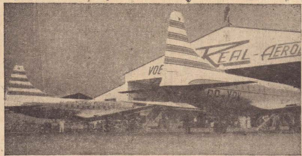
Hangar e aparelhos da Real