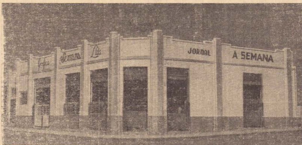
NO CLICHÊ vemos uma vista da fachada do prédio do jornal "A SEMANA" de Paraguaçu Paulista.

Por ocasião de uma visita a vizinha cidade de Paraguaçu Paulista, na semana passada, tivemos a oportunidade de percorrermos as instalações do semanário daquela localidade, que conta com um ótimo corpo de redatores. Na oportunidade verificamos como é feita a impressão daquele jornal, bem como ficamos conhecendo diversos funcionários daquele órgão de imprensa. Ficamos bastante satisfeitos com a visita e apresentamos aos dirigentes, inclusive funcionários daquele jornal, os nossos cumprimentos pela organização daquele periódico.