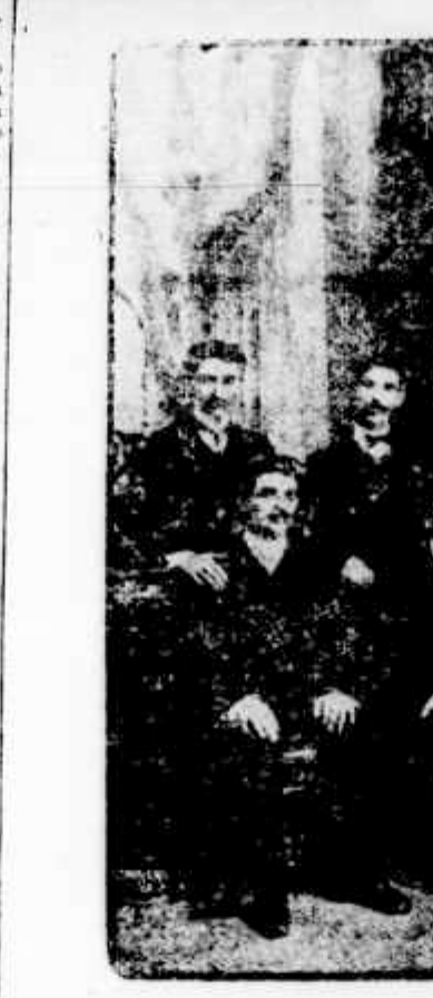
Directoria da Sociedade Beneficente dos Barbeiros e Cabelleiros