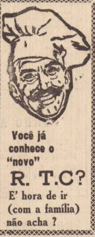
Você já conhece o "novo" R. T.C?

quela cidade em São Paulo, tendo hospitais e pronto socorro socorrido as pequenas vítimas. O próprio estabelecimento de ensino transformou-se em um grande nosocômio, onde dezenas de alunos ficaram em observação.