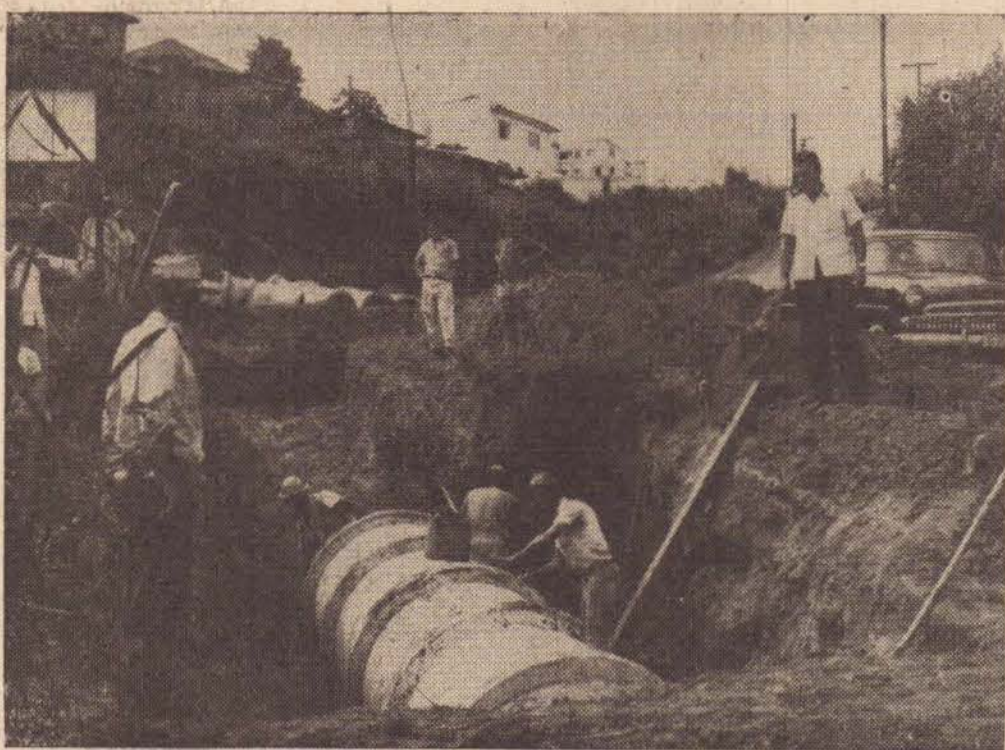
Galeria de águas pluviais na Vila Verinha

É dos mais impressionantes o ritmo de trabalho que vem desenvolvendo o Prefeito Watal Ishibashi na execução de obras por parte do executivo. No setor de iluminação já está em pleno funcionamento a iluminação a vapor de mercúrio na Praça Nove de Julho, antes com escassa luz. O prédio do Tiro de Guerra 231, no alto do Jardim Bongiovani está praticamente concluído, restando tão somente raspar o assoalho. Essa obra, segundo as palavras do chefe do executivo estará em condições de ser usada dentro de mais alguns dias. Em menos de um mês, a sede do Tiro de Guerra deverá ser em prédio novo, moderno, amplo e com melhores condições aos atiradores.