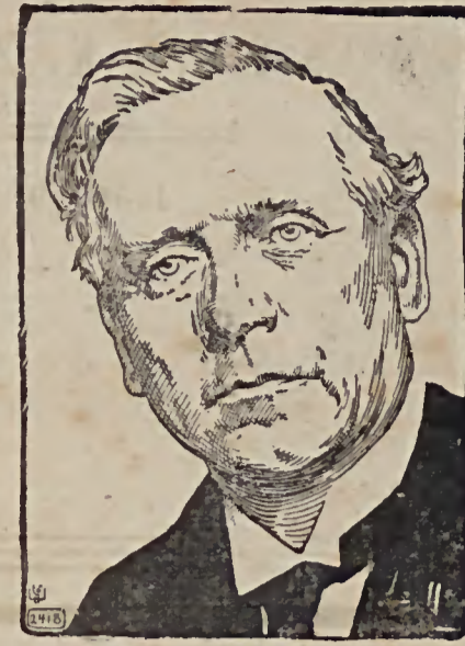
Sir Herbert Asquith, der englische Ministerpräsident, der am 21. September seinen 60. Geburtstag feiert.