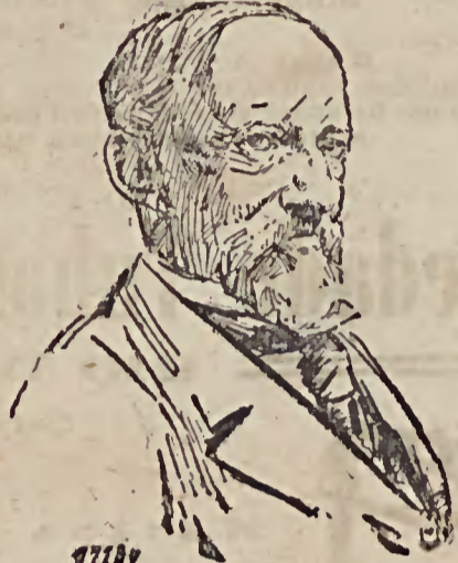
Oskar Strauß, ehemaliger Volschalter der Vereinigten Staaten in Konstantinopel, der von dem im Staat New York tagenden Staatskonvent der Republikanischen Fortschrittspartei als Gouverneurskandidat aufgestellt wurde. Oskar Strauß, ein geborener Deutscher, ist ein Bruder des bekannten Reichs-Volschalters Grafen Strauß.