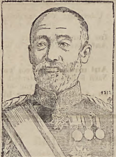
Der japanische Feldmarschall Graf Saigō, der Eroberer von Port Arthur, der aus Sankt Petersburg zu dem verstorbenen Mikado Selbstmord beging.