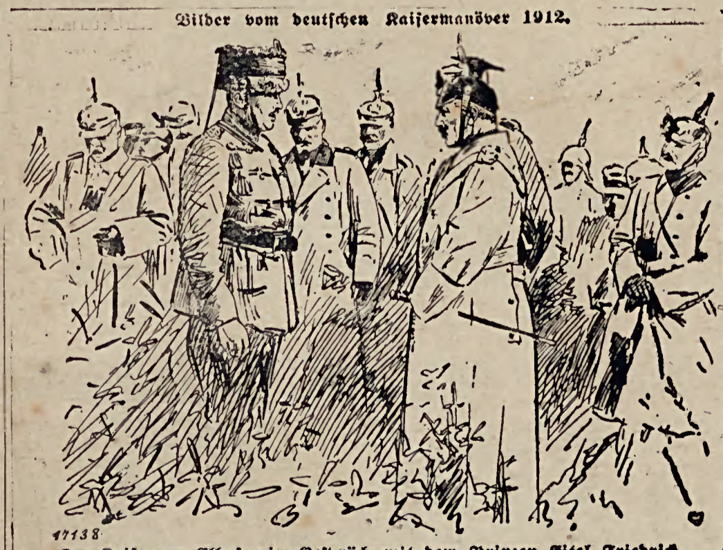
Der Kaiser am Elberfer im Gespräch mit dem Prinzen Eitel Friedrich.