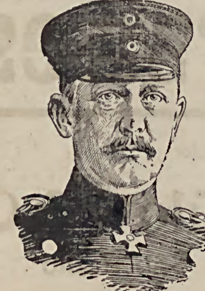
General der Infanterie Sellmuth von Blotitz, Chef des Generalstabes, der Leiter des Manövers.

Dampfer quer durch Rußland von Riga nach Odessa fährt. Die wirtschaftlichen Vorteile, die aus diesem Kanalbau erwachsen würden, liegen auf der Hand; aber auch strategisch wäre er nicht ohne Bedeutung, und die kleineren Schiffe der russischen Kriegsflotte würden sich gleichfalls des neuen Weges bedienen können.