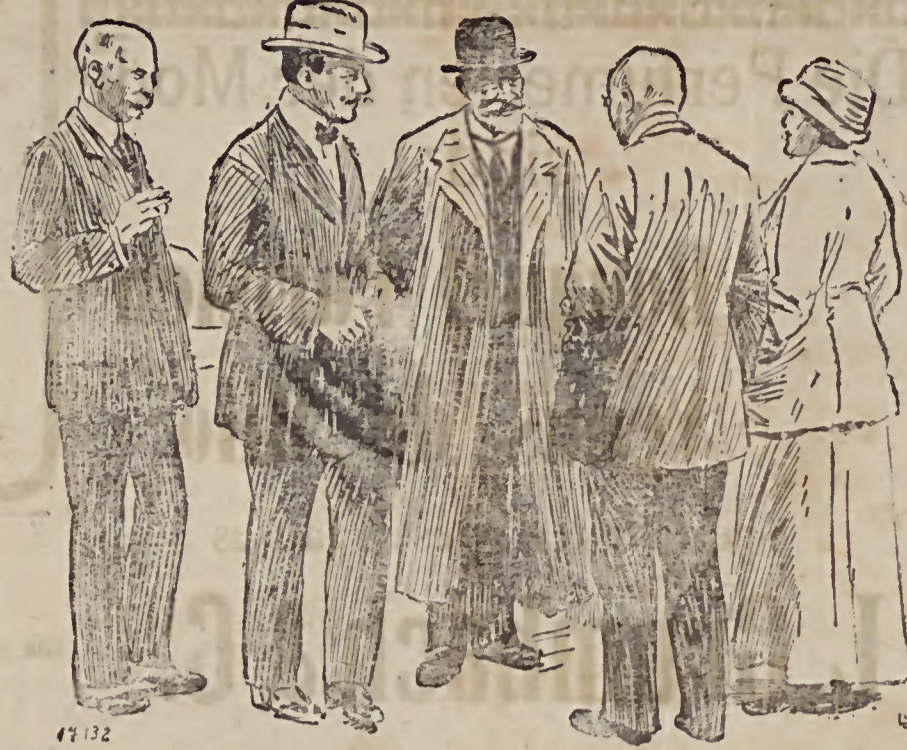
Im Aufzuge des Reichskanzlers von Bethmann Hollweg bei dem Kaiserlichen ungarischen Minister des Auswärtigen Grafen Tisza. Die beiden Minister (in der Mitte der Gruppe) im Gespräch mit dem deutschen Volschalter in Wien, der Fürstlich-Botschafter.