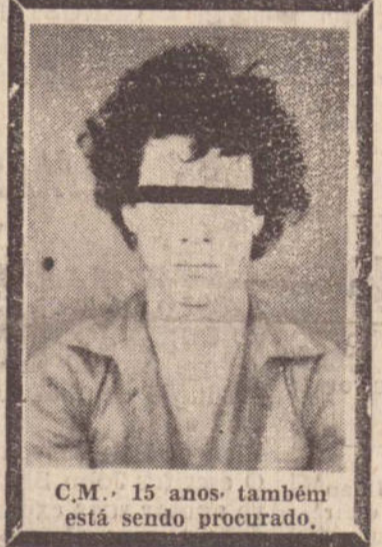
C.M. 15 anos também está sendo procurado.