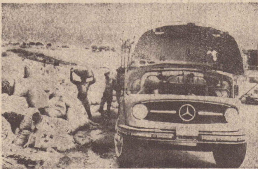
A foto mostra o caminhão em posição normal, após os trabalhos realizados por um carro guincho.

Ontem na parte da manhã ocorreu mais um acidente rodoviário em nossa cidade. O caminhão placa TT-4906, de Dracena, dirigido por Fumio Ogura tombou nas proximidades do 18.º BPM, no trevo rodoviário. Segundo Laerte Ferrari, que estava viajando juntamente com o motorista: o carro não estava em alta velocidade e o que ocasionou a queda do veículo foi a carga de amendoim que estava muito alta. "Mas se o carro viesse em velocidade normal dificilmente poderia tombar" foi o que disse o policial que esteve no local. "O motorista não conseguiu fazer a curva e o caminhão balançou" — foi o que disse Laerte Ferrari — "Fiquei com medo quando vi que o carro ia capotar. Maior medo ainda, passei quando notei que o caminhão ia cair no precipício. Mas Fumio para não deixar o veículo cair no abismo, virou no máximo a direção. Sendo bruscamente jogado para a esquerda o carro não resistiu o peso dos 475 sacos de