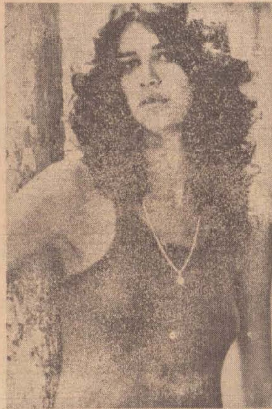
SEXTA SUPER — GLOBO DE OURO

00,00 hora — Coruja Colorida — Filme OS DOIS INDOMAVEIS — Montana 1880. Ross Bondine (Holden), 50 anos e Frank Post (O'Neal), 25 anos, vaqueiro de uma fazenda, decidem mudar de vida após presenciarem a morte de um amigo. Assalam um banco, e partem para o México, onde pretendem comprar um rancho. O ex-patrão Walter Buckman, (Malden) envia os dois filhos John Paul (Skerrit e Baker) à sua procura