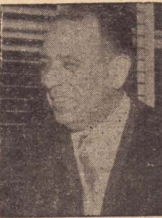
O sr. José Ermirio de Moraes, convidado a assumir a Chefia da Embaixada do Brasil na Alemanha