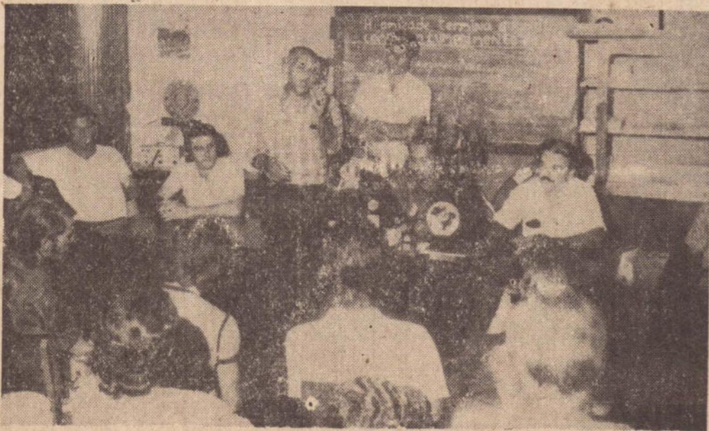
Na foto a mesa diretiva e parte da plateia que prestigiou a entrega dos prêmios aos melhores no campeonato amador da cidade