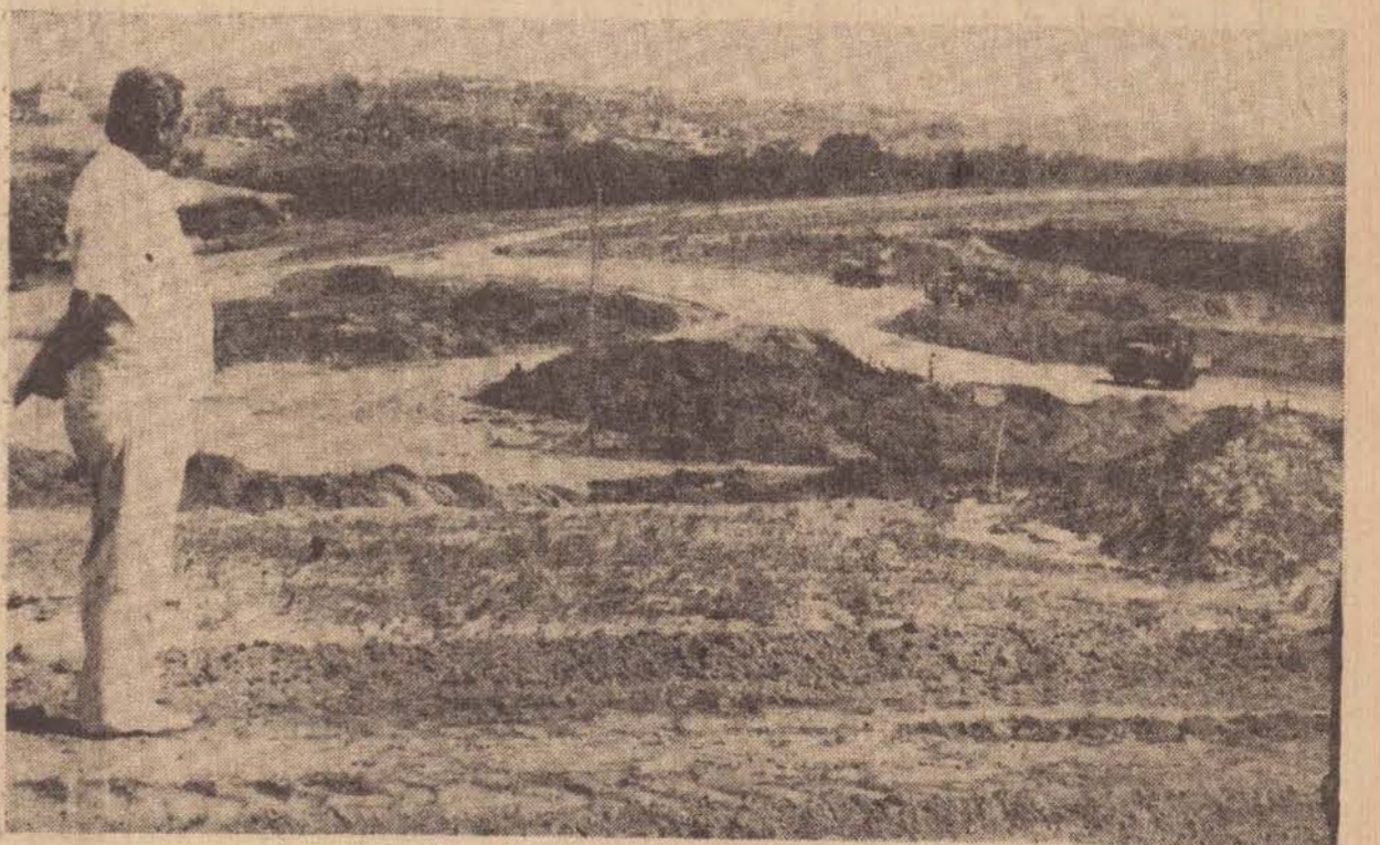
A terraplenagem é feita numa área de 193.600 m2.

Com o problema de combustível, principalmente a falta de óleo diesel, que foi de certa forma racionado, a Prefeitura teve que reduzir o número de máquinas no trabalho de terraplenagem do Estádio Municipal — Prudentão — na área de 8 alqueires adqui-