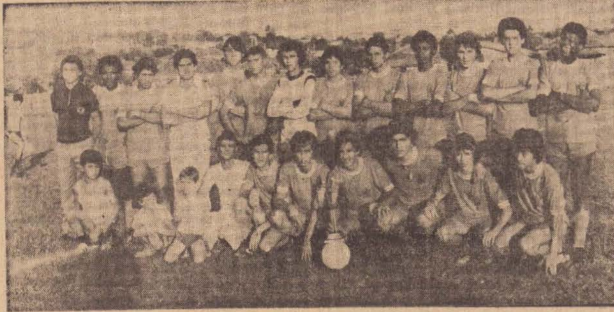
Equipe das Casas Jamil F.C., campeão