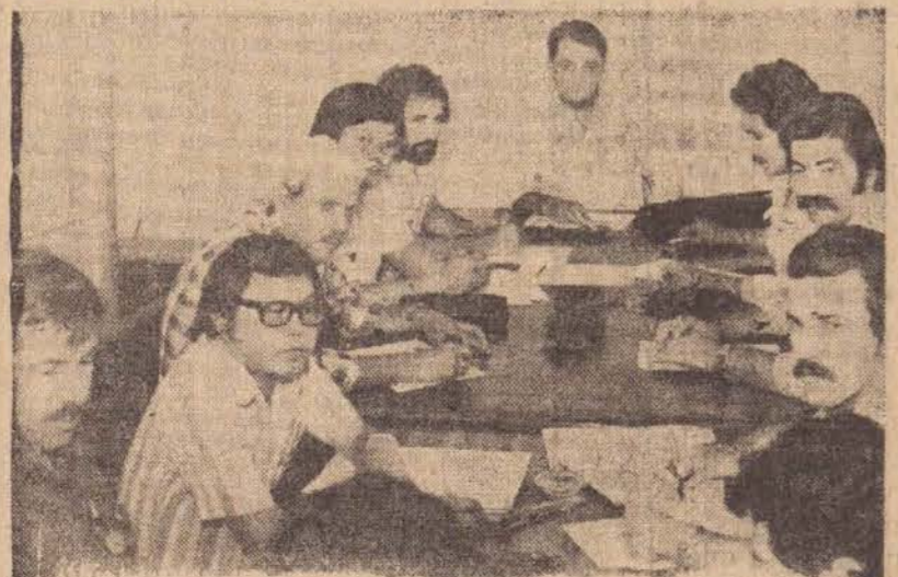
Aspecto da reunião da comissão que julga a concorrência pública para construção de duas creches em bairros da cidade.

As obras das creches na Vila Formosa e no Jardim Monte Alto deverão se iniciar em novembro e o prefeito Paulo Constantino espera inaugurá-las em meados de 1980.