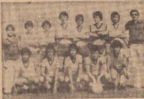
Equipe da Gráfica Depieri.