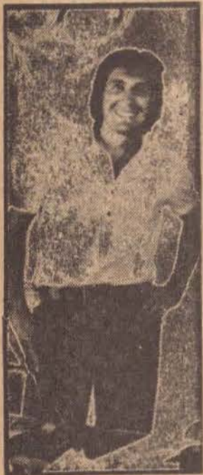
nas, com nossos parabéns.