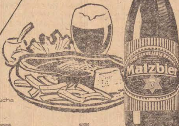
churrasco à gaúcha

É positivo! Seu organismo ganha um substancial reforço quando você pede Malzbier da Brahma para acompanhar sua alimentação, seja ela qual fôr. No preparo de Malzbier da Brahma entra o malte mais rico e energético. Por isso, Malzbier da Brahma é de fato nutritiva e... positivamente de-li-ci-o-sa!