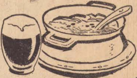
xinxim de galinha