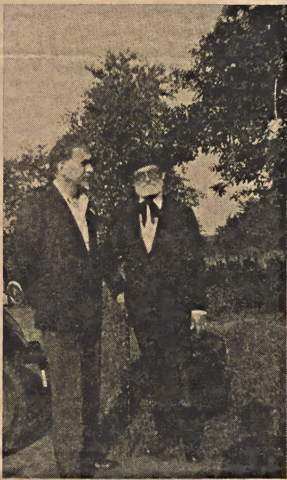
Armando Borghi (1882-1968) e Hippolyte Havel (1869-1950) ad una delle nostre scampagnate.

Bisogna riconoscere che le masse si sono lasciate profondamente demoralizzare, snervare, per non dire castrare dall'azione deleteria della civiltà di Stato. Schiacciate, avvilitate, esse hanno contratto l'abitudine fatale d'una obbedienza e d'una rassegnazione percorile, e si sono per conseguenza trasformate in immensi greggi artificialmente divisi e rinchiusi, per la maggiore comodità dei loro sfruttatori d'ogni specie.