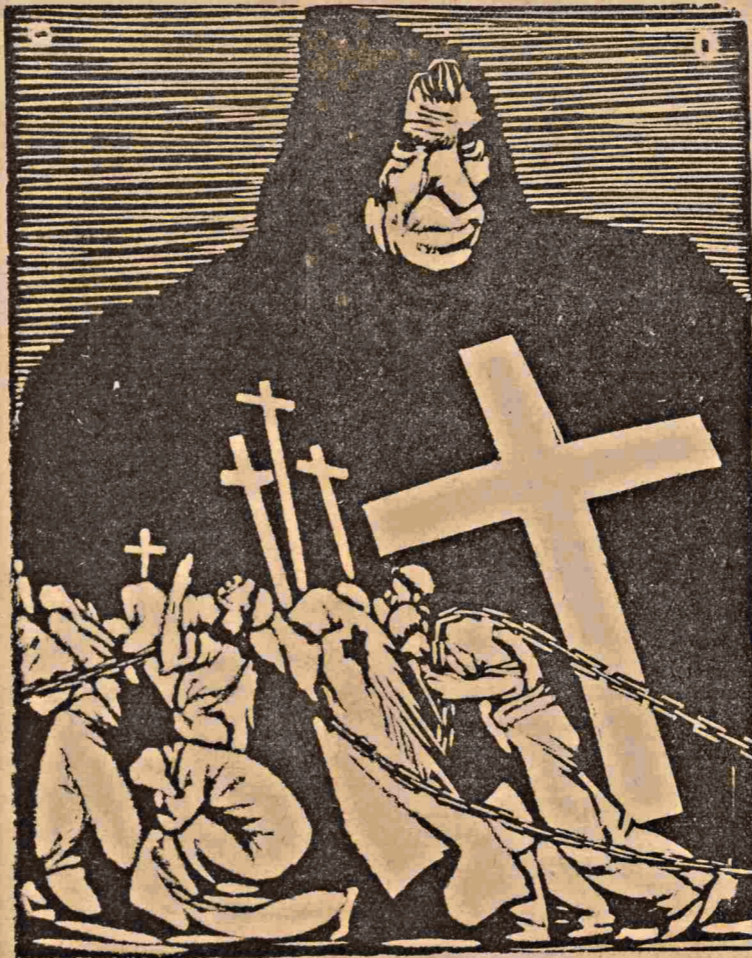
O monstro negro que ameaça acorrentar o povo brasileiro ao jugo odioso do Vaticano.

Em vista da dificuldade em fazer a cobrança no Rio de Janeiro, pois raras vezes são encontrados em casa os assinantes, pedimos a todos os que se interessam pela publicação de "A LANTERNA" e que ainda não pagaram as suas assinaturas o favor de as mandar pagar á rua Jorge Rudge, 110 - vila - C. 2, ao sr. José Lomar.