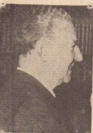
Governador Ademar de Barros

O Governador Ademar de Barros (foto) vem de autorizar benefício para Presidente Prudente, da ordem de Cr$ 1.138.518.700, para a construção da Unidade Integrada, de nossa cidade. É teor de despacho feito ao engenheiro Alberto de Zagotis, em que o chefe do executivo paulista determina, inclusive, que essa obra, que centralizará todo o serviço da saúde pública, deve ser executada num espaço mínimo de 15 meses, invariavelmente.