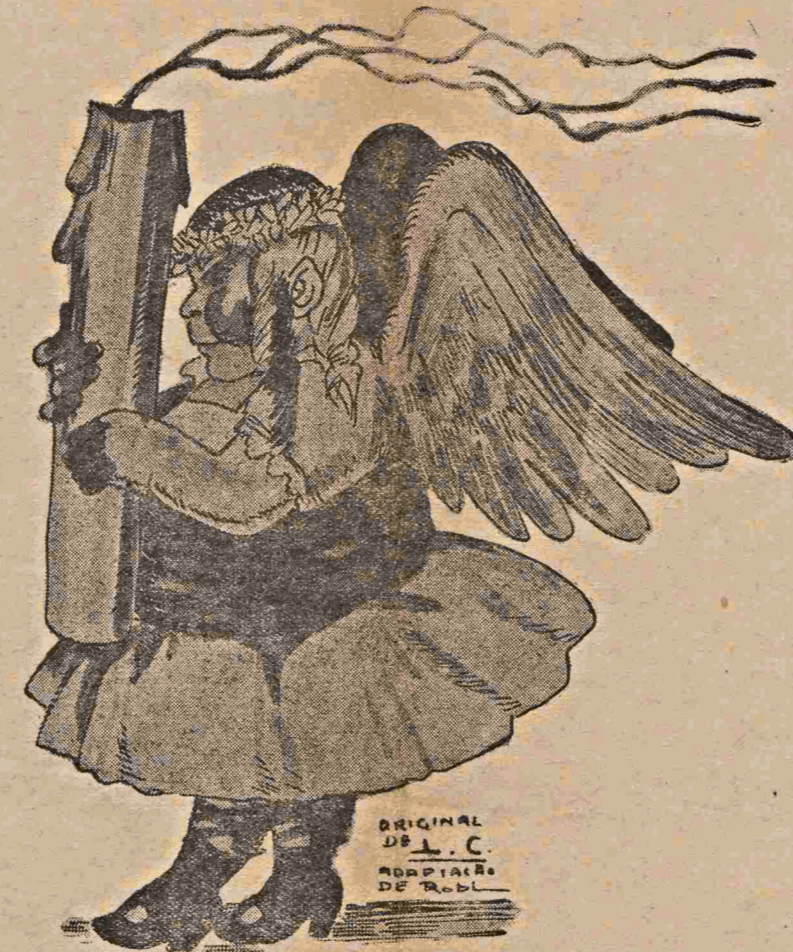
Os anjos teatrais caminham lentamente Vão cheios de suor e apertam-lhes os calos As botas de verniz.

Recebemos desta organização laicista, sucessora da Liga Anticlericalista, de Porto Alegre, o seguinte comunicado: "Em sessão de diretoria foi apresentada a seguinte chapa, dependendo de aprovação da assembléa geral, anunciada para 11 do corrente, para a Diretoria que deverá dirigir a Liga no bienio 1935-1937."