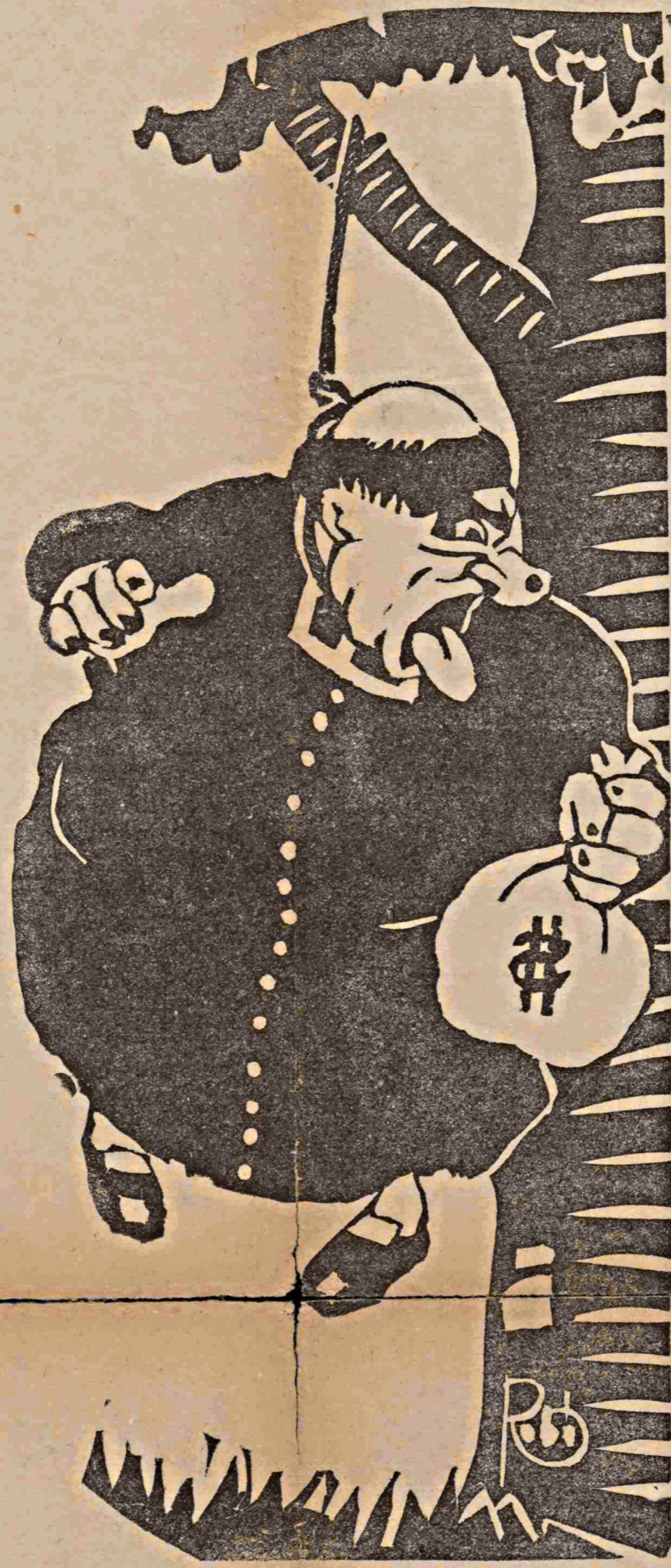
O Judas moderno...