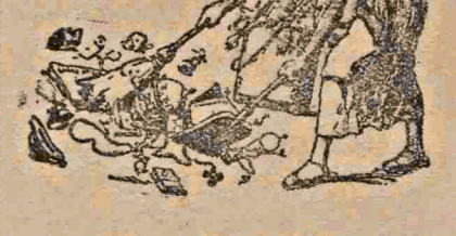
LATA DO LIXO...