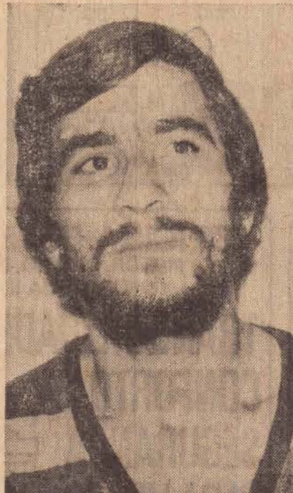
S.E.I. TIROU ASSALTANTE DE CIRCULAÇÃO

Recolhido ao xadrez do presídio daquela cidade, o assassino encontra-se à disposição da justiça incurso no artigo 121 do código penal e agravantes.