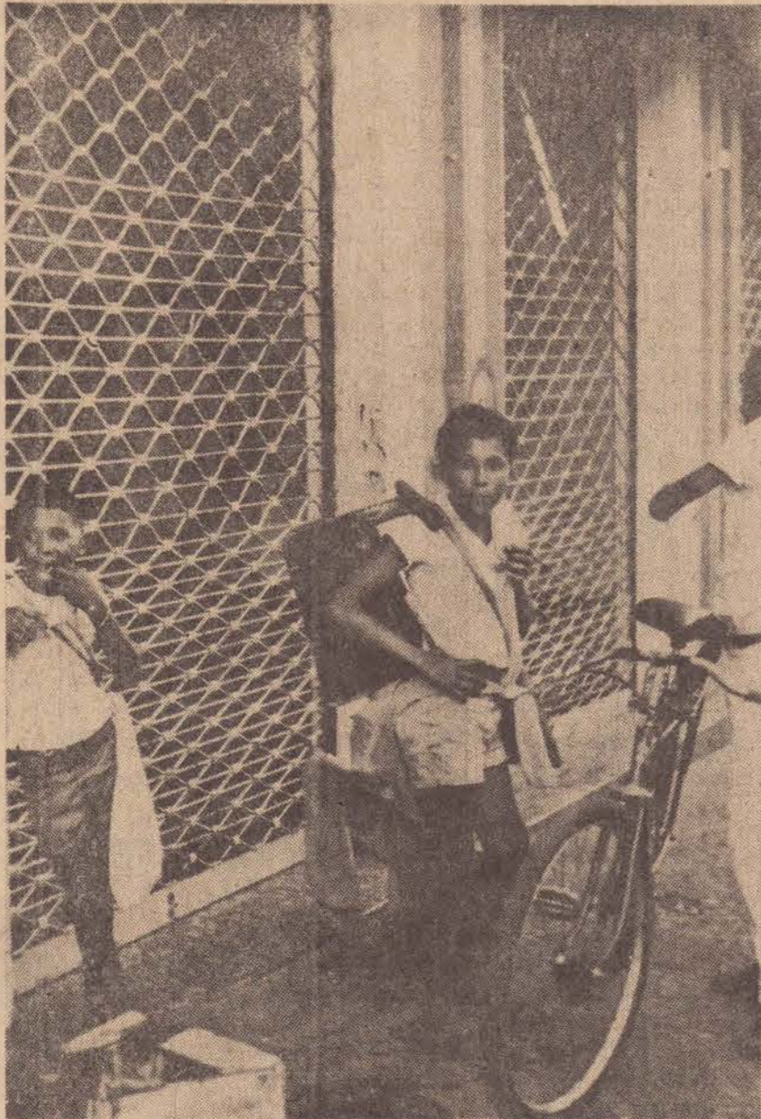
Uma das portas do prédio abandonado, onde dormem garotos e mulheres

As informações foram dadas pelo Secretário da Receita, Francisco Neves Dornelles, ao anunciar que na próxima semana divulgará alguns parâmetros utilizados pela fiscalização do exame dos dados apresentados pelos contribuintes nas declarações, tanto da pessoa física como jurídica, que servem para a chamada operação malha. Segundo Dornelles, a divulgação antecipada desses parâmetros antes que os contribuintes preencham seus formulários é para que eles não sejam surpreendidos depois, quando receberem notificações informando que descontos e aplicações em fundos fiscais e compra de ações foram glosados. A arrecadação do Imposto de Renda das pessoas físicas, empresas, e o arrecadado na fonte, totalizaram Cr$ 1,6 trilhão, em 1982, informou Dornelles. Pág. 4.