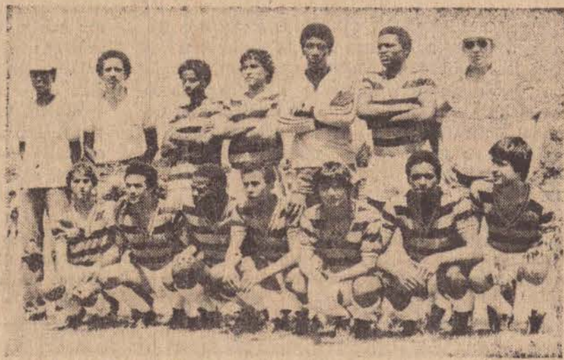
Equipe do CR Flamengo, campeão do Torneio Extra

08 — Nas competições realizadas para a inauguração de Pista de Atletismo, a equipe de Guarulhos, levou a melhor sendo a grande vencedora da competição, suplantando a equipe