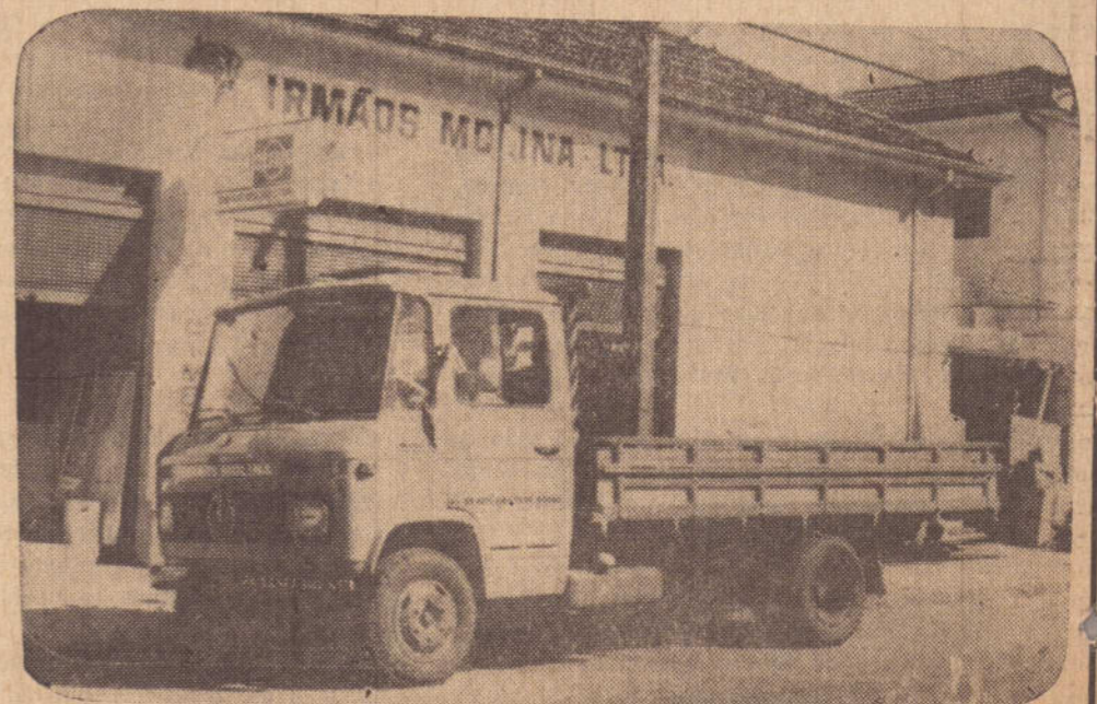
L-608D (MERCEDINHO) — MAIS UM PRODUTO DA Mercedes — Benz do Brasil S A