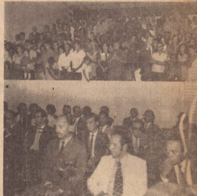
Parte da assistência tanto em cima como em baixo