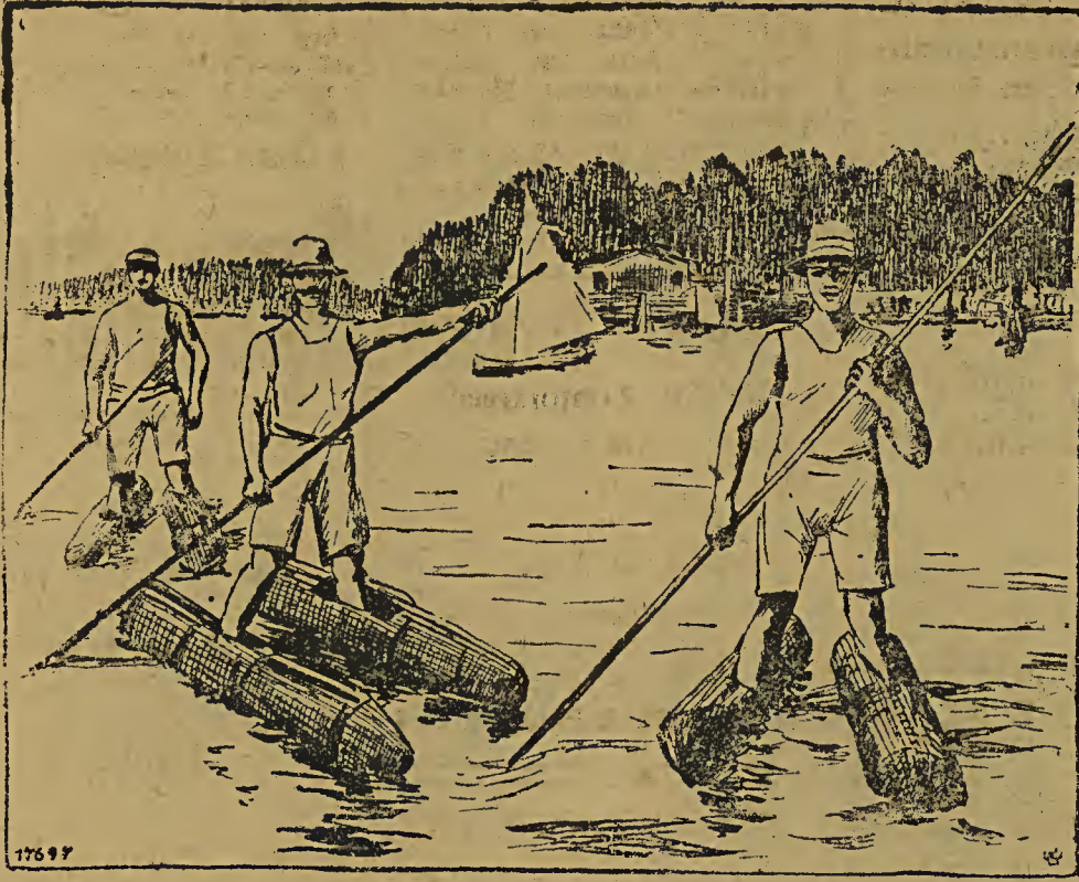
Wasserskier auf der Havel. Auf den Gewässern in der Umgegend von Berlin kann man jetzt oftmals Vertreter dieser neuen Sportart sehen, die, Wasserschuhe an den Füßen, eine Art Ruderklinge in den Händen, auf den Wellen entlanggleiten.

rank: Typus Meline und Deschanel. Woher schreibt sich dieser Wechsel der Pariser Physis? Der Sport, dessen Pflege auch in Frankreich täglich zunimmt, der verdorbene Magen, der, wenn man dem Spott der modernen französischen Satiriker glauben darf, beinahe zur modernen französischen Nationaleigentümlichkeit geworden ist, die anstrengenden modernen Tänze, wie der bewußte Tango, die geborene Todfeinde allen Embonpoints sind, schließlich die Hast und Aufregung des modernen Lebens (das alles mag zusammenwirken) und der langen Rede kurzer Sinn ist für den Mitarbeiter des Pariser Blattes, daß die französische Rasse in einer richtigen Umbildung begriffen ist und aus einem behaglich gesättigten Volke zu einem nervösen wird. Früher hatten es die Sozialisten bequem: sie konnten die Gesellschaft in zwei Klassen einteilen, in die mit den dicken und in die mit den dünnen Bäuchen. Das ist ein Bonmot von vorgestern. Auch unter den Bäuchen herrscht völlige Gleichheit.