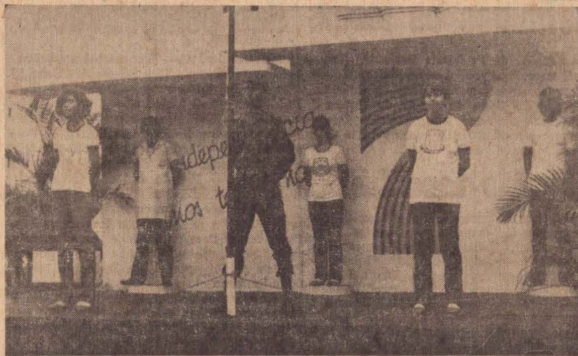
Na foto, aparecem alunos da EEPG Catarina Martins Artero, e um soldado do TG no altar da Pátria.

Desde as 8 horas da última segunda-feira, primeiro dia da Semana da Pátria, os estudantes da rede de ensino, oficial e particular do município de Pres. Prudente, estão se revezando na guarda de honra do altar da pátria, armado na Praça Monsenhor Sarrion, sempre com a assistência de um soldado do Tiro de Guerra.