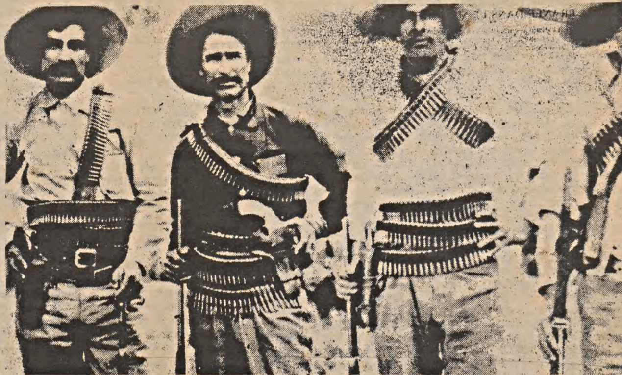
Revolucionários Mexicanos: "A revolução é um momento, o revolucionário todos os momentos."

A situação após 38 anos de ditadura do general Porfírio Díaz ficou insustentável, a miséria entre o povo e a acumulação de riquezas entre uns poucos chegou a níveis talvez nunca vistos na história humana. E explodiu a Revolução! O grito de "TERRA E LIBERDADE!" levantado primeiramente pelo anarquista Ricardo Flores Magón e seus companheiros, e posto em prática pelo líder guerrilheiro Emiliano Zapata e os camponeses do Estado de Morelos (sul do país), foi ouvido em todo o mundo.