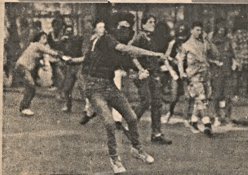
Rebelião estudantil em Atenas

Depois de uma marcha pelo centro da cidade, estudantes gregos enfrentaram a polícia nas ruas de Atenas, atirando pedras e promovendo muita confusão, tendo como estopim da agitação a reivindicação de mais verbas para o ensino. A polícia reagiu com bombas de gás e dispersou a manifestação, enquanto dezenas de