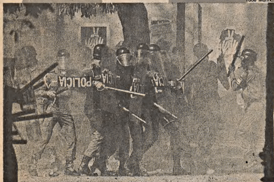
A repressão se atralha com o gás lacrimogêneo.

Não devemos ter qualquer ilusão diante desta falsa liberdade democrática que continua perseguindo duramente as atividades políticas não permitidas pelo Estado.