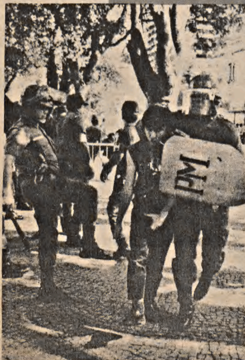
A covardia policial no leilão da USIMINAS.

A manifestação começou às 10:00h e decorreu pacificamente até às 12:30h, quando iniciou-se uma série de conflitos que se estenderam pela tarde inteira. Os manifestantes tentaram derrubar o cordão de isolamento feito pelas tropas de choque do governador "socialista", o fascista Brizola. A polícia começou espancando um homem e a reação foi imediata: uma chuva de pedras. Bombas de efeito moral e gás lacrimogênio, atitude porca e covarde da democracia fascista, mas os manifestantes resistiram.