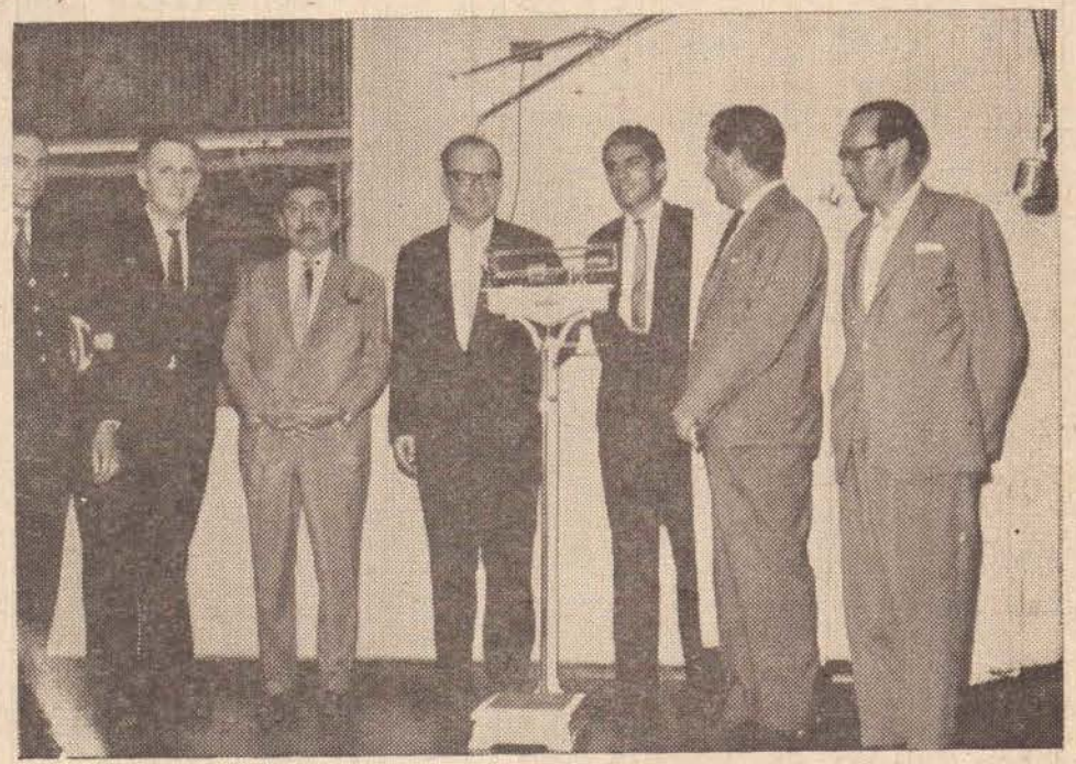
A FOTOGRAFIA E A NOTICIA