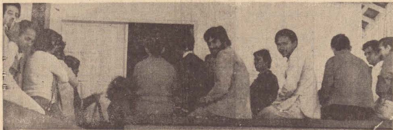
A alegria estava estampada no rosto daqueles que foram convocados pela Cohab, "finalmente realizado o sonho da casa própria".

As pessoas que foram classificadas ao programa habitacional popular da Cohab em Presidente Prudente não compareceram até hoje às 12 horas (meio-dia) no escritório da campanha serão excluídas da relação, em benefício de outros, conforme afirmação das assistentes sociais que hoje a tarde retornam a Brasília.