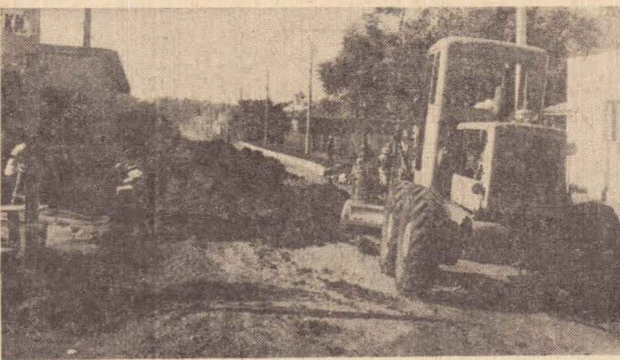
Aspecto da Vila Formosa em Anaurilândia, que passará a receber benefícios

O prédio conta com salas de espera, registro, exame de gestante, farmácia, gabinete odontológico, imunização, esterilização, curativos, repouso, consultório e exames, além da área de serviço. Contem ainda sanitários privativos dos médicos, dos funcionários e outros dedicados ao público.