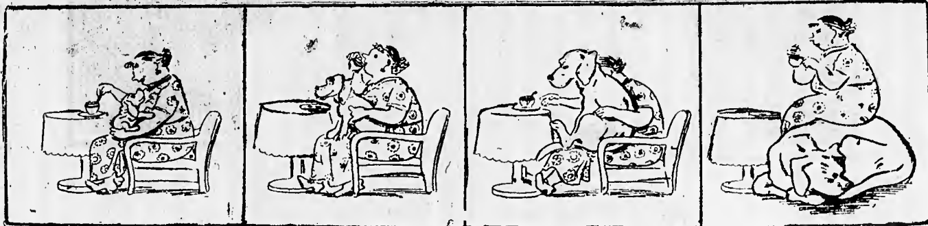
L'INATTESO SVILUPPO DEL CANE DA CACCIA.

— Beh?! L'hai vista? — Aspetta: ancora non la vedo bene. (Disegno molto animato di Orazio Cardilli)