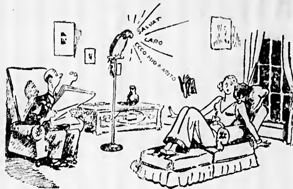
IL PAPPAGALLO: — Salvati, caro: ecco mio marito!

manifesto: "Alt! Righetto ha scaricato oggi due barili di vino rosso a 5$000 il litro").