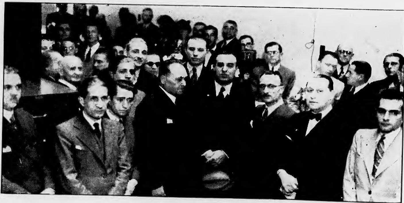
Gruppo di funzionari ed intervenuti alla cerimonia dell'inaugurazione.