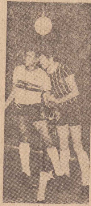
Tendo sofrido uma forte distensão muscular, o zagueiro Espanhol estará a margem da partida de domingo em Rio Claro

ESPANHOL AUSENTE A grande baixa na equipe