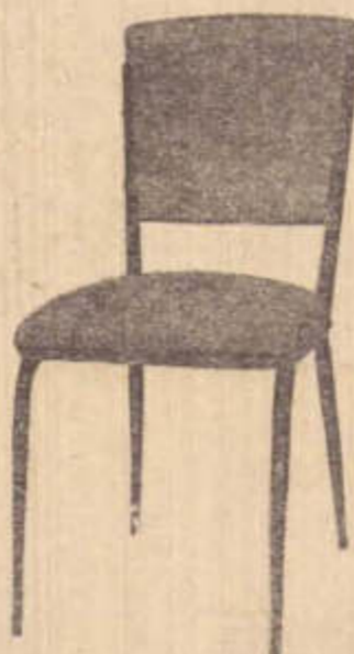
CADEIRA PRESIDENTE DESDE 490,00 POR MÊS

Oferece a você a oportunidade unica de comprar sua copa formica pelo preço de fabrica em 10 pagamentos sem acrescimo