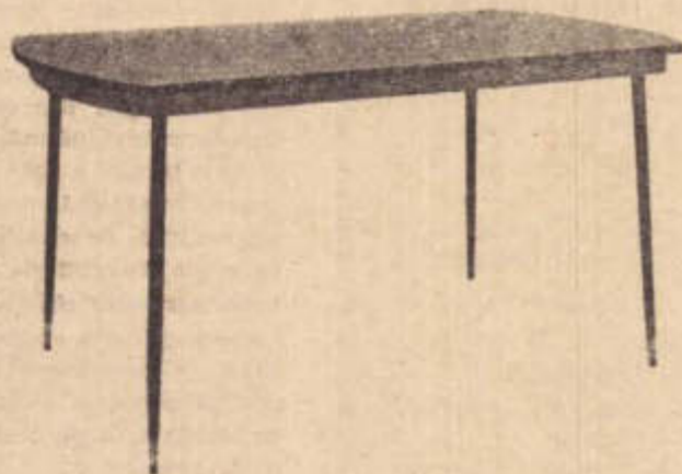
MESA ELASTICA PRESIDENTE DE 1,50 x 1,50 x 90 x 40 DESDE 2.970,00 POR MÊS

Oferece a você a oportunidade unica de comprar sua copa formica pelo preço de fabrica em 10 pagamentos sem acrescimo