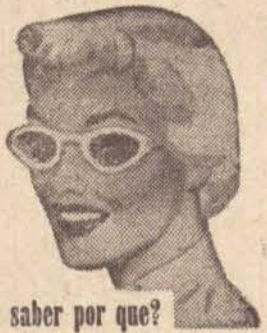
Quer saber por que?