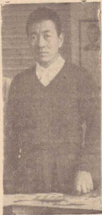
Já promulgada, embora não tenha ainda entrado em vigor, a nova Carta Constitucional Brasileira, que veio substituir a Constituição de 1946. O docu-

É a preocupação da labuta diária em dar-mos à Presidente Prudente um bom jornal, isento de diretrizes estranhas, e, se em algum tempo tomamos a iniciativa de acompanhá-los esta ou aquela tendência, não e fizemos em detrimento da cidade, mas sim na complementação da busca pelo seu desenvolvimento, pois eis que O Imparcial é prudente também. Nós, redação e oficinas, apenas apresentamos a equipe que o faz funcionar. Ele é o todo que não pode possuir falhas nas interpretações que divulga, no noticiário que veicula, em prol do engrandecimento da cidade e da região que serve. Deveria ser, e o conseguirá certamente, o espelho de um povo, na utilização deste mesmo povo, e é ao que nos propuzemos.