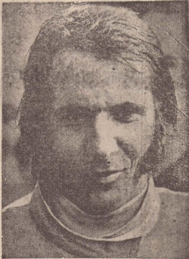
Emerson Fittipaldi, agora pilotando o Copersucar foi bem nos treinos de ontem.

Foram realizados ontem as duas primeiras sessões de treinos para o Grande Premio de Fórmula Um, amanhã em Interlagos, abrindo assim a temporada de 1976.