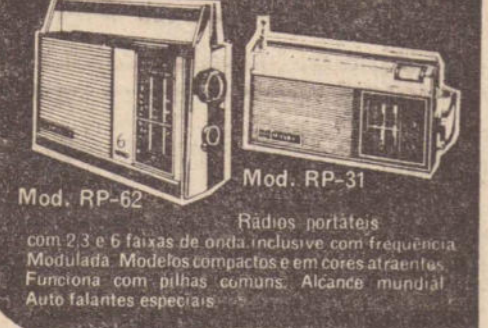
Mod. RP-62 Rádio portátil com 23 e 6 faixas de onda inclusive com frequência Modulada. Modulos compactos e em cores atraentes. Funciona com pilhas comuns. Alcance mundial. Auto falantes especiais. Mod. RP-31