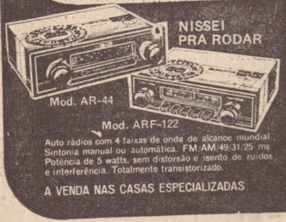
Mod. AR-44 Mod. ARF-122 Auto rádios com 4 faixas de onda de alcance mundial. Sintonia manual ou automática. FM AM/49/31/25 ms. Potência de 5 watts, sem distorção e isento de ruídos e interferência. Totalmente transistorizado. A VENDA NAS CASAS ESPECIALIZADAS