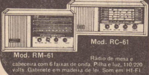
Mod. RM-61 Rádio de mesa e cabeceira com 6 faixas de onda. Pilha e luz, 110/220 volts. Gabinete em madeira de lei. Som em HI-FI. Mod. RC-61