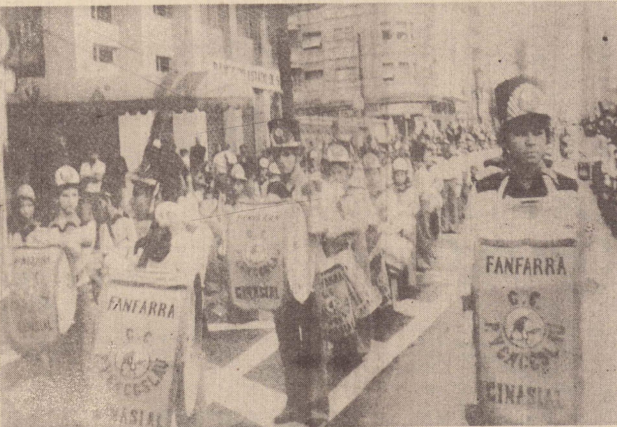
A fanfarras do Ginásio Estadual de Pres. Venceslau.

medida que a água vai caindo, o couro vai esticando, dando um som horrível".