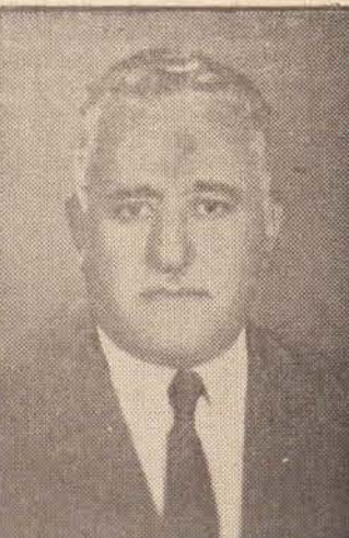
Deputado Francisco Franco, Presidente da Assembléia Legislativa.

des, sendo ponto alto, nesse dia, a realização de bailes nos clubes locais. No dia 13, domingo, dia do aniversário da cidade, haverá alvorada pela Banda da Força Pública do Estado e salva de 21 tiros, seguida de missa campal, às 8.30. Às 9.45 horas, recepção no aeroporto às autoridades, visitantes, entre as quais, secretário de Estado e representantes do governo. Às 10 horas, desfile com a participação de várias escolas e carros alegóricos.