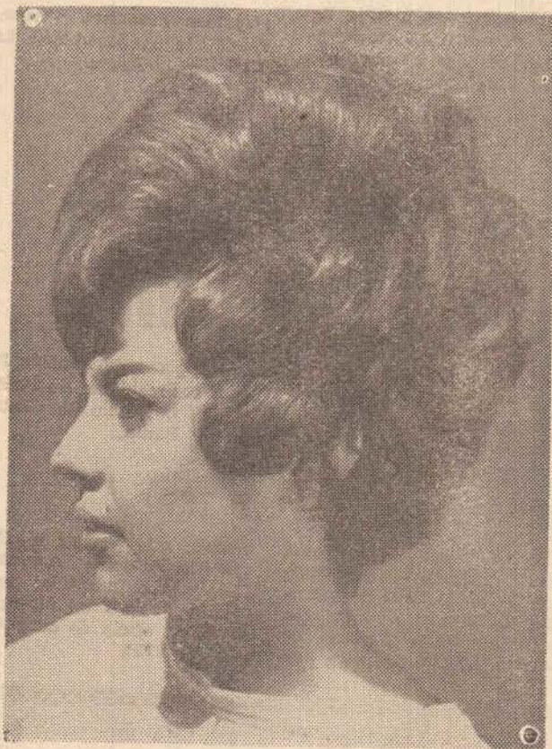
Não é mesmo de levantar os cabelos. Só que não é de susto, mas sim de graça... Tchof, que quem levanto fui eu...

E MANDE CONFECCIONAR AINDA HOJE O SEU SMOKING Rua Dr. Gurgel, 198