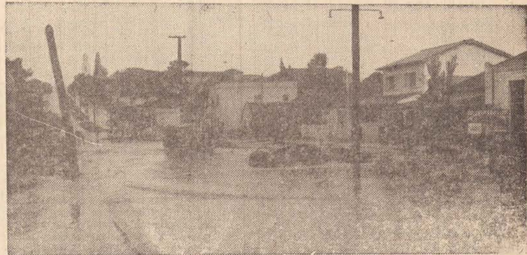
Na foto, uma das causas das erosões: as enchentes por má distribuição ou escoamento de águas, quando até atingem as cidades.

Também o Instituto Agronômico de Campinas oferece valiosa colaboração nessa tarefa de revelar a importância da prática conservacionista. Através da Seção de Conservação do Solo, vem realizando uma série de estudos para o levantamento das causas e efeitos das perdas do solo e água nos vários sistemas de exploração agrícola, bem como a determinação e experimentação de práticas de conservação do solo. Essa pesquisa é realizada em instalações especiais, onde é recolhido, medido e analisado o material erodido, coletado em pontos representativos dos principais tipos de solo do Esta-