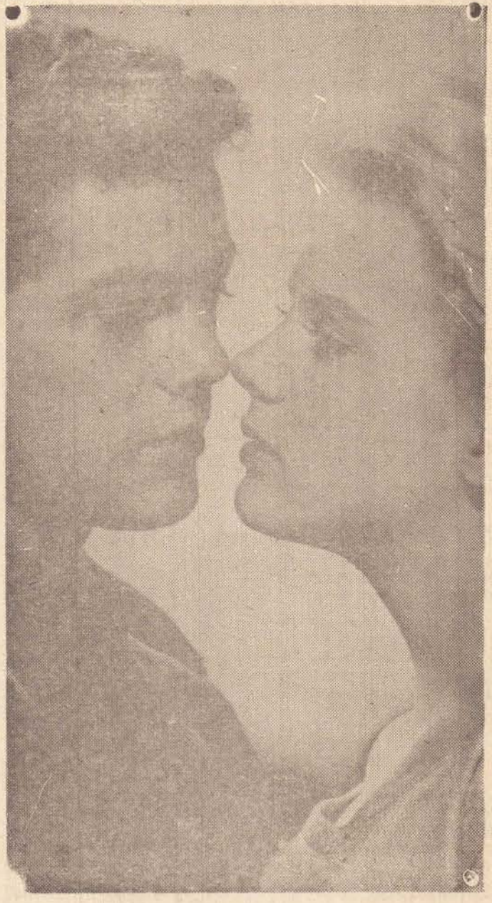
A FOTOGRAFIA É A NOTICIA

Iremos ao público. Ele dará sua resposta final e popular sobre o que pensa. Que desse pensamento, resultem os elementos para o raciocínio daqueles responsáveis por nossa boa paz e progresso.